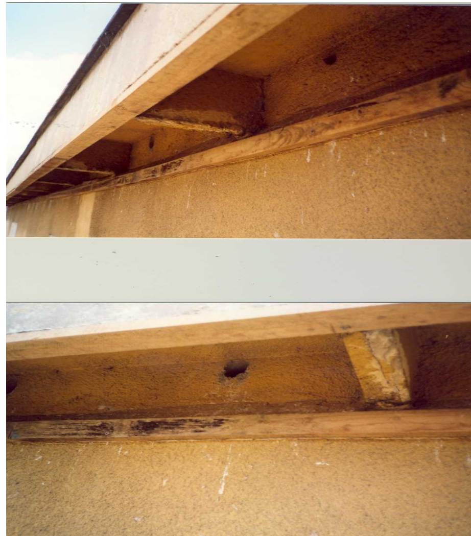
"Póleczka" pod otworami prowadzącymi do stropodachu - miejsce popularne wśród gołębi. Drewniane elementy to pozostałość po założonej siatce. Po zdemontowaniu siatki, jerzyki mogły dostać się do swoich gniazd i odbyły lęgi z sukcesem.