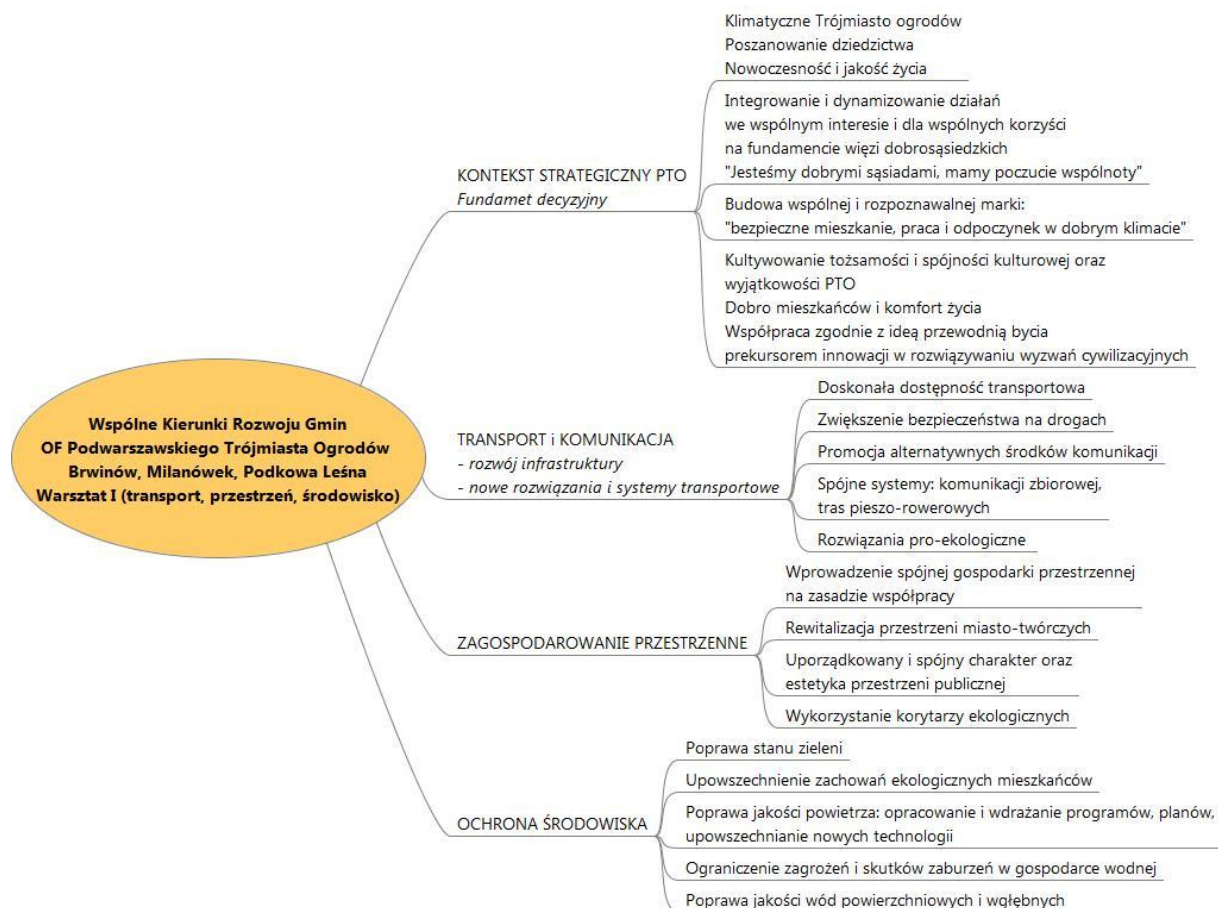
Obraz 1. Wspólne kierunki strategiczne ustalone na warsztacie: uwarunkowania przestrzenne, środowiskowe i transportowe

Podsumowanie efektów warsztatów na poziomie ustaleń wspólnych kierunków strategicznych, zostało przedstawione w formie wizualizacji scalonej. Wizualizacja efektów prac warsztatowych będzie pomocna w kontynuowaniu procesów myślenia i dialogu strategicznego, opracowaniu strategii PTO oraz strategii sektorowych a także badaniu spójności kierunków strategicznych z projektami wdrożeniowymi.