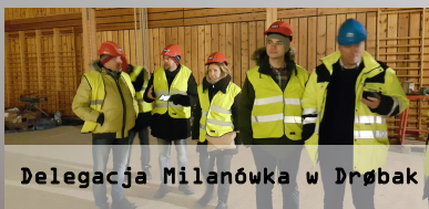
Delegacja Milanówka w Drøbak

Współpracę rozpoczęto od wizyty przedstawicieli gminy Milanówek w dniach 12-14 grudnia 2016 r. Elementem rewizyty w dniach 6-8 lutego 2017 r. jest wydarzenie Era NOWYCH TECHNOLOGII w Milanówku, na którym mieszkańcy będą mieli możliwość zapoznania się z mikroprojektem oraz partnerską gminą Frogn. Nawiązane kontakty staną się bazą do powstania platformy wymiany praktyk oraz stanowić będą wsparcie przy realizacji przedsięwzięć inwestycyjnych.