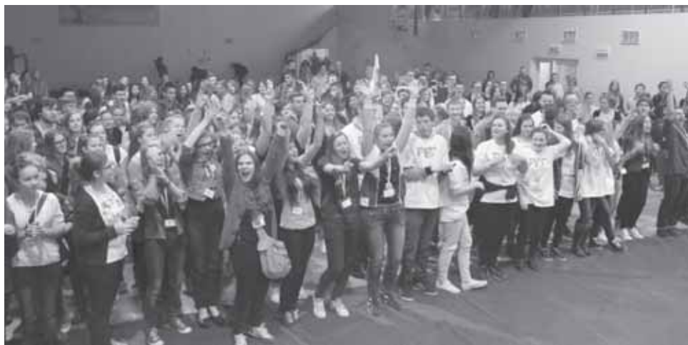
Rozpoczęcie II Gminnego Przystanku PaT w Milanówku