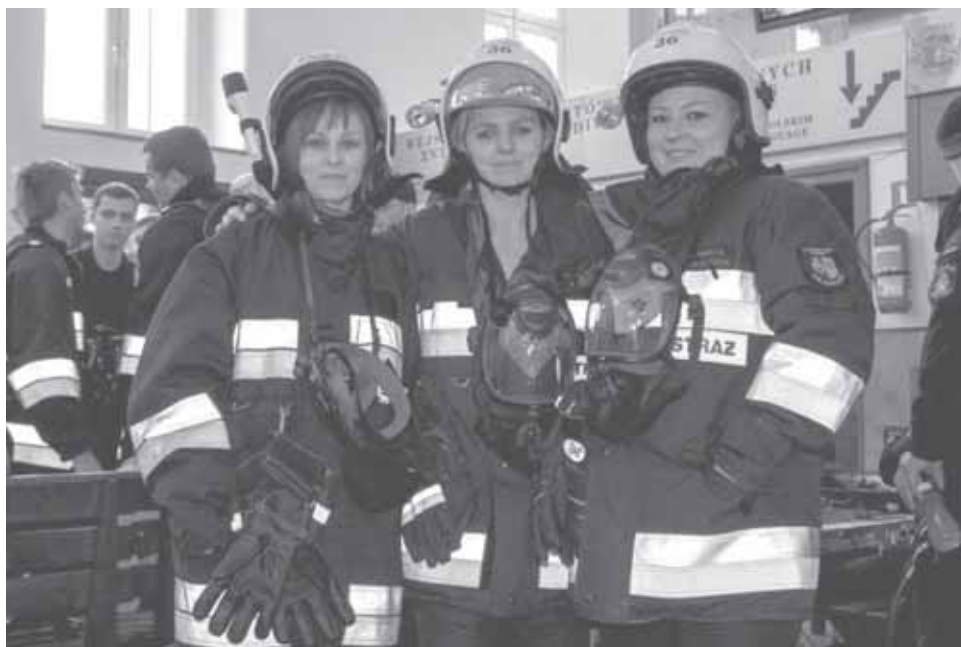
Żeńska drużyna OSP Milanówek

Drużyna żeńska z czasem dziesięć minut, trzydzieści sekund i pięćdziesiąt setnych uplasowała się na trzecim miejscu wśród startujących w Wieliczce drużyn kobiecych. Strażaczki odebrały dyplom – pierwszy jaki został zdobyty w bieganii po schodach przez milanowskich ratowników.