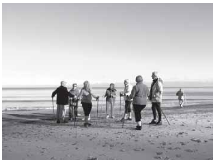
Warsztaty zdrowia na morzem.