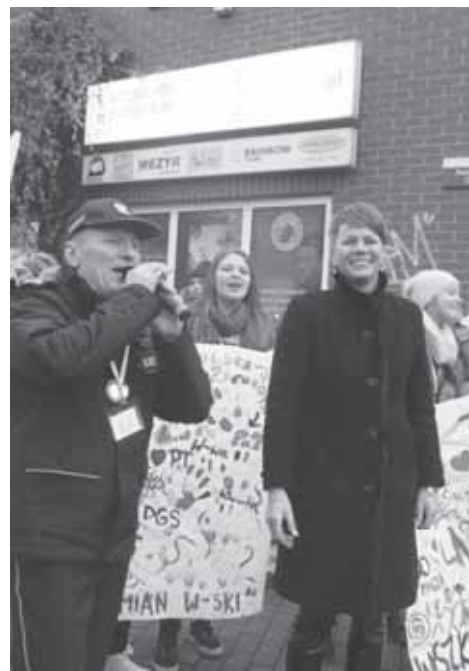
PaTosfera na ulicach Milanówka