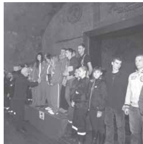
Zwycięzcy VI Barbórkowego Turnieju Strażaków i Ratowników w kat. OSP