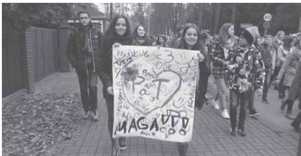
Uczestnicy II Gminnego Przystanku PaT promowali na ulicach Milanówka modę na życie wolne od uzależnień i przemocy