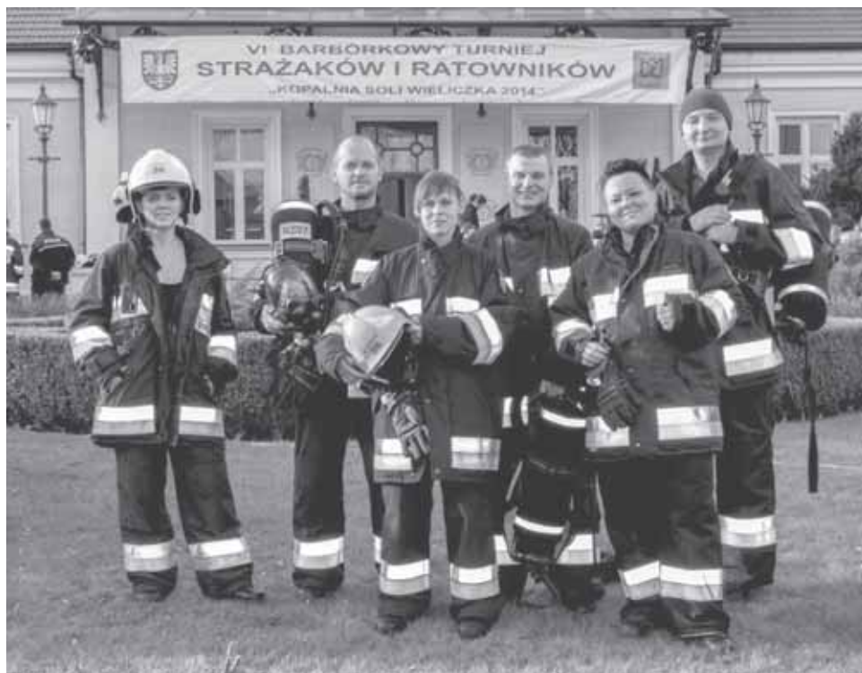
Strażacy z Milanówka po raz drugi brali udział w zawodach

Startujące trzyosobowe drużyny w pełni umundurowane (mundur bojowy, rękawice i buty strażackie, hełm ochronny, latarka w systemie Ex) i wyposażone w aparaty ochrony dróg oddechowych miały za zadanie pokonanie schodów przy szybie Daniłowicza kopalni soli w Wieliczce. Następnie po drabinie kierowali się na klatkę schodową (90 podestów, 650 schodów). Po pokonaniu schodów, w połowie oświetlonych