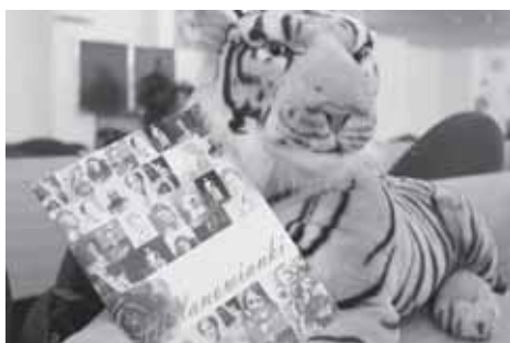
Publikacja pt. „Milanowianki” wydana w ramach projektu

Rozpoczął się drugi etap projektu „Milanowianki”. Rok temu uczestniczki pierwszej fazy projektu przygotowały rekonstrukcję kobiecych historii, których zwieńczeniem