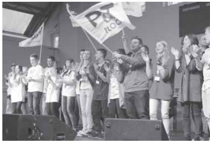
Hymn Przystanku PaT podczas rozpoczęcia akcji edukacyjno-artystycznej