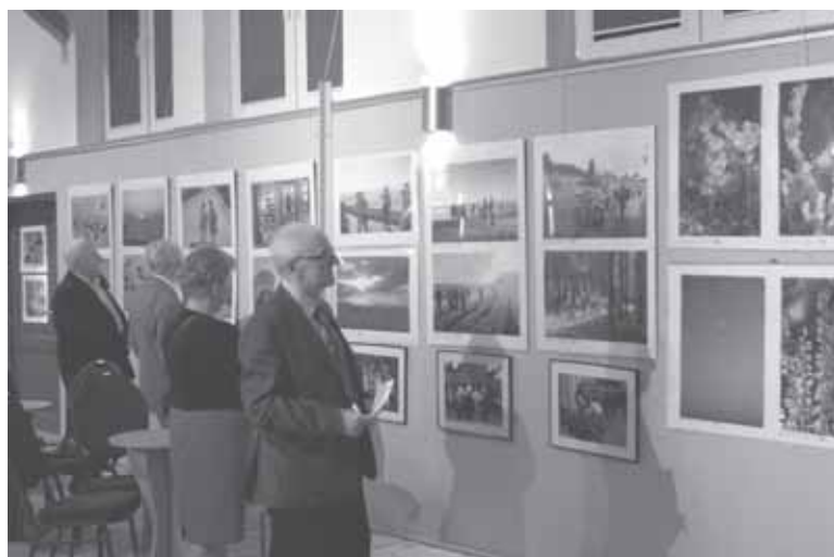
Fragment wystawy rysunkowo-fotograficznej.