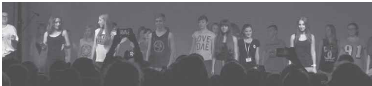
Gala finałowa Przystanku PaT w ZSG nr 3