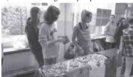
Przysmaki już gotowe