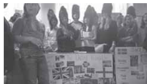
Te nakrycia głowy wykonaliśmy samodzielnie