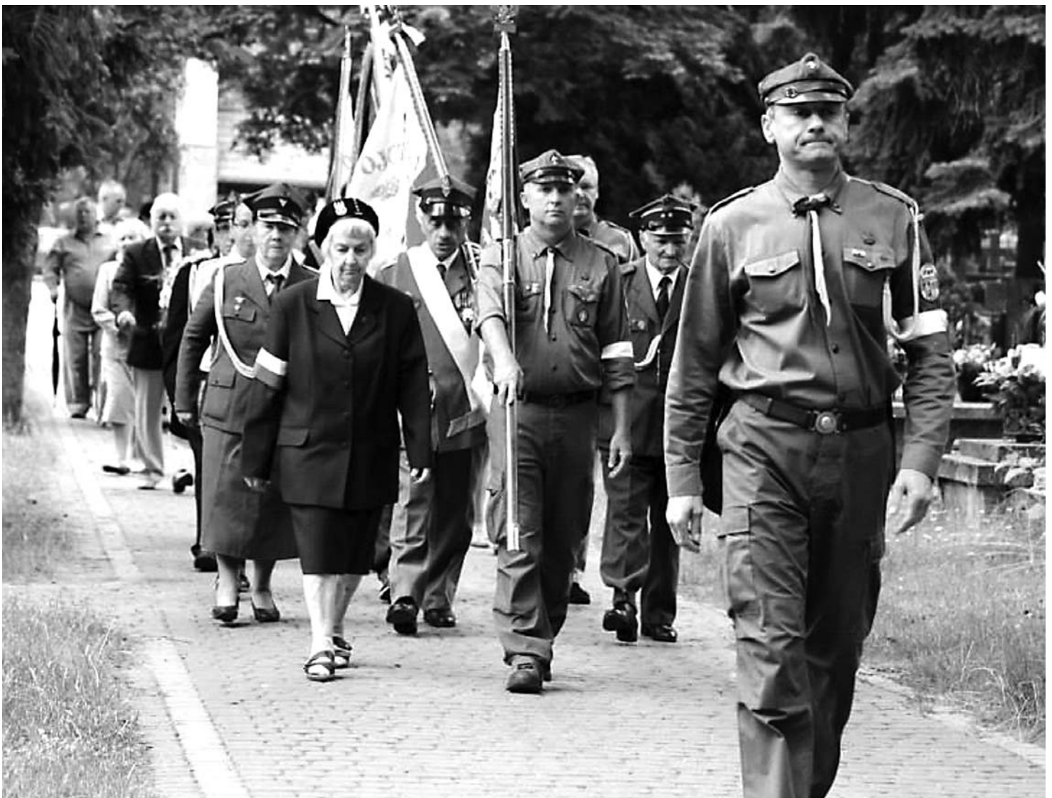
Oddanie hołdu poległym na milanowskim cmentarzu.