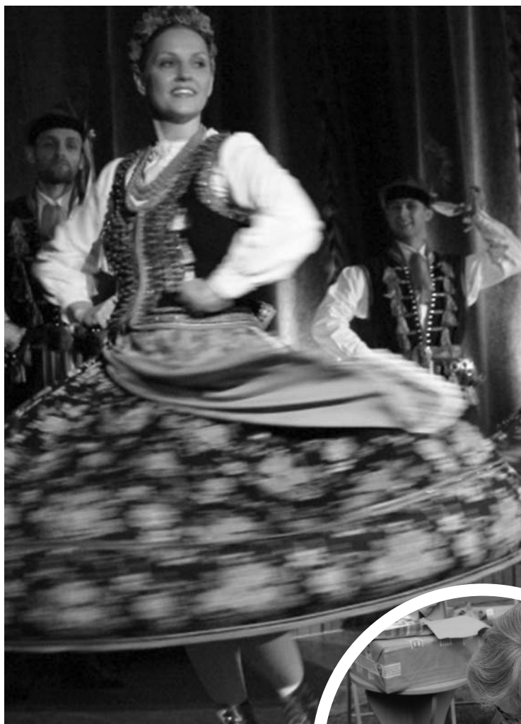
Uroczyste otwarcie Festiwalu - koncert pieśni i tańców ludowych, w wykonaniu zespołu „Polski Łan”.