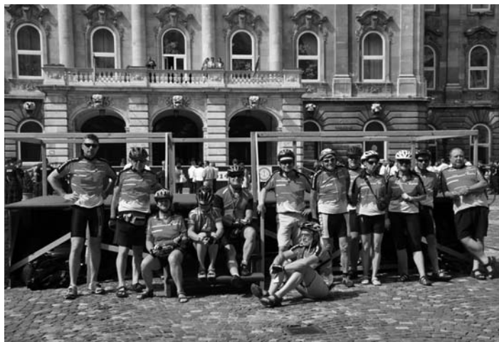
Przed Ratuszem Miejskim w Budapeszcie.

W tym roku Sekcja Turystyki Rowerowej Milanówek odwiedziła cztery kraje na południu Europy: Węgry, Słowację, Austrię i Czechy. Zwiedziliśmy trzy stolice - Budapeszt, Bratysławę i Wiedeń. Przekreśliśmy ponad 600 km. Udział wzięło 14 osób.