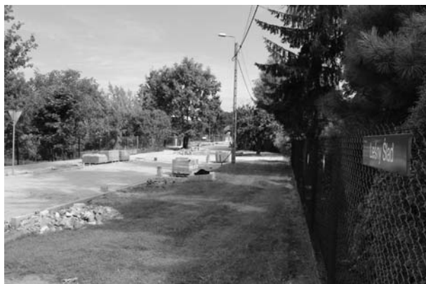
ul. Leśny Ślad od Podleśnej do Gospodarskiej