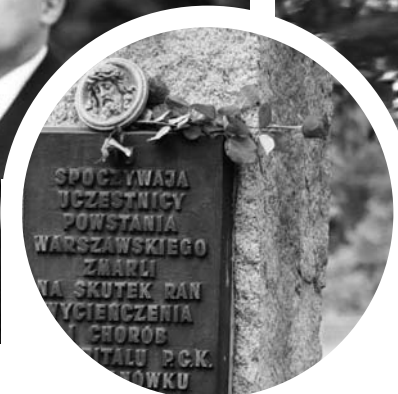
Mogila zbiorowa powstańców warszawskich.