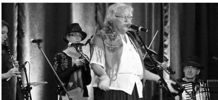
Zespół Nok Pęd Band podczas koncertu zakończenia FOO.