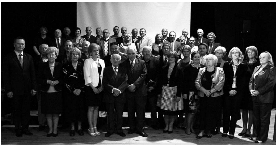
Radni i Burmistrzowie Miasta Milanówka w latach 1990-2014 podczas uroczystej XXXVIII Sesji Rady Miasta.