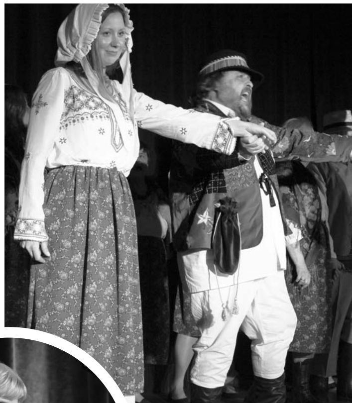
Spektakl „Gody weselne” wg Leona Schillera - widowisko obrzędowe w wykonaniu Stowarzyszenia T-Art.