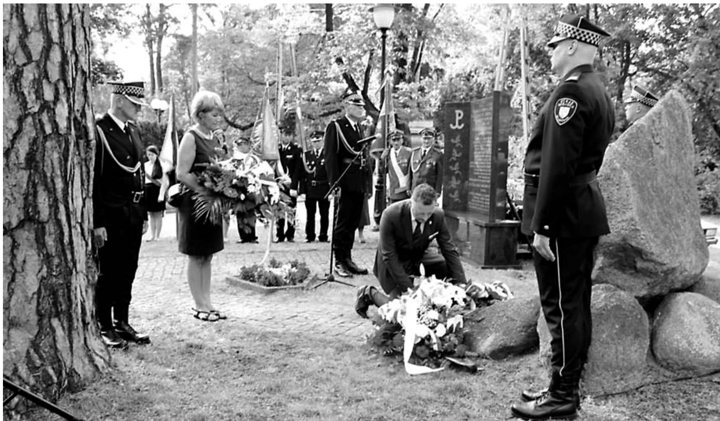
Złożenie kwiatów na Skwerze Armii Krajowej przy ul. Kościuszki.