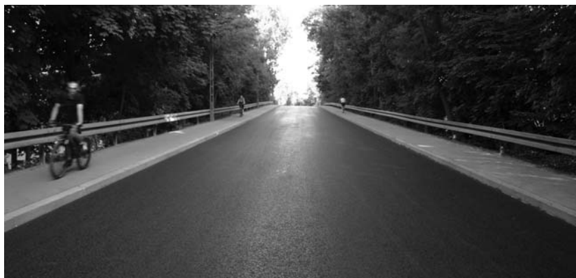
Wyremontowany wiadukt w ulicy Smoleńskiego