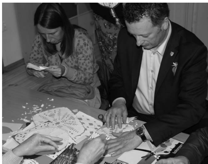
Burmistrz Miasta Milanówka w trakcie naklejania wycinanki podczas Święta Truskawki.