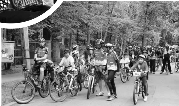
Rajd ulicami Milanówka, połączony ze zwiedzaniem milanowskich ogrodów.