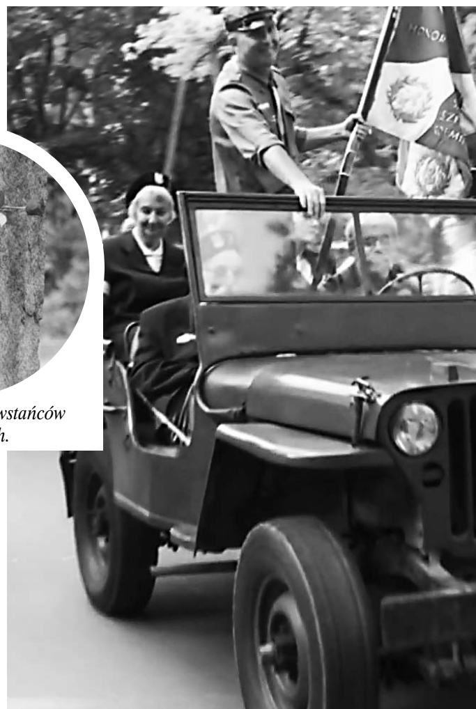
Zabytkowy jeep na czele pochodu.