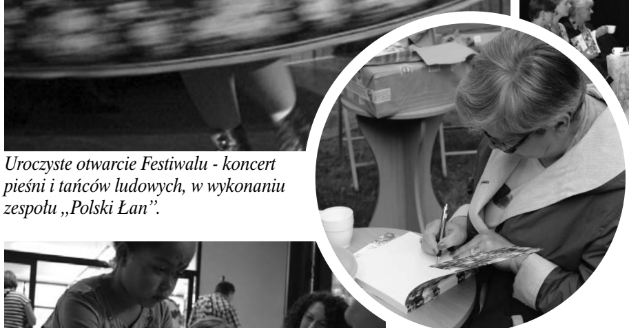
Promocja książki „Milanowianki” – spotkanie z autorkami.