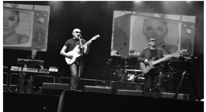
Zespół KOMBII podczas 13 Dnia Milanówka w 2013 r.