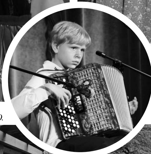
Zakończenie Festiwalu - koncert „NieOSTATNI AKORDeon”.