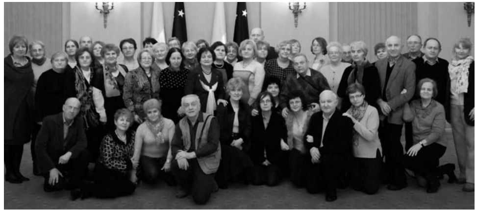
MU3W w Pałacu Prezydenckim (2013 r.)

Program MU3W obejmuje wykłady, seminaria, spotkania w Saloniku Literackim. Planowane są kursy języków obcych, praca w grupach zainteresowań, zajęcia ruchowe - gimnastyka, taniec, joga. Uczestnictwo w zajęciach jest dobrowolne. Nie ma u nas egzaminów i kolokwium. Wiele zajęć jest bezpłatnych dzięki dotacjom MPiPS i Burmistrza Milanówka.