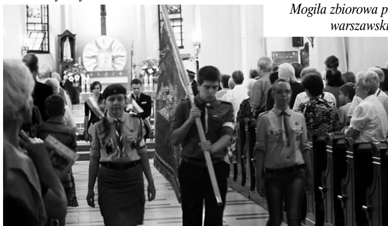
Uroczysta msza św. w Kościele pw. św. Jadwigi Śląskiej.