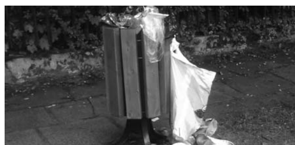
Kosz przy ul. Parkowej.

Kierownik Referatu Ochrony Środowiska i Gospodarki Zielenią