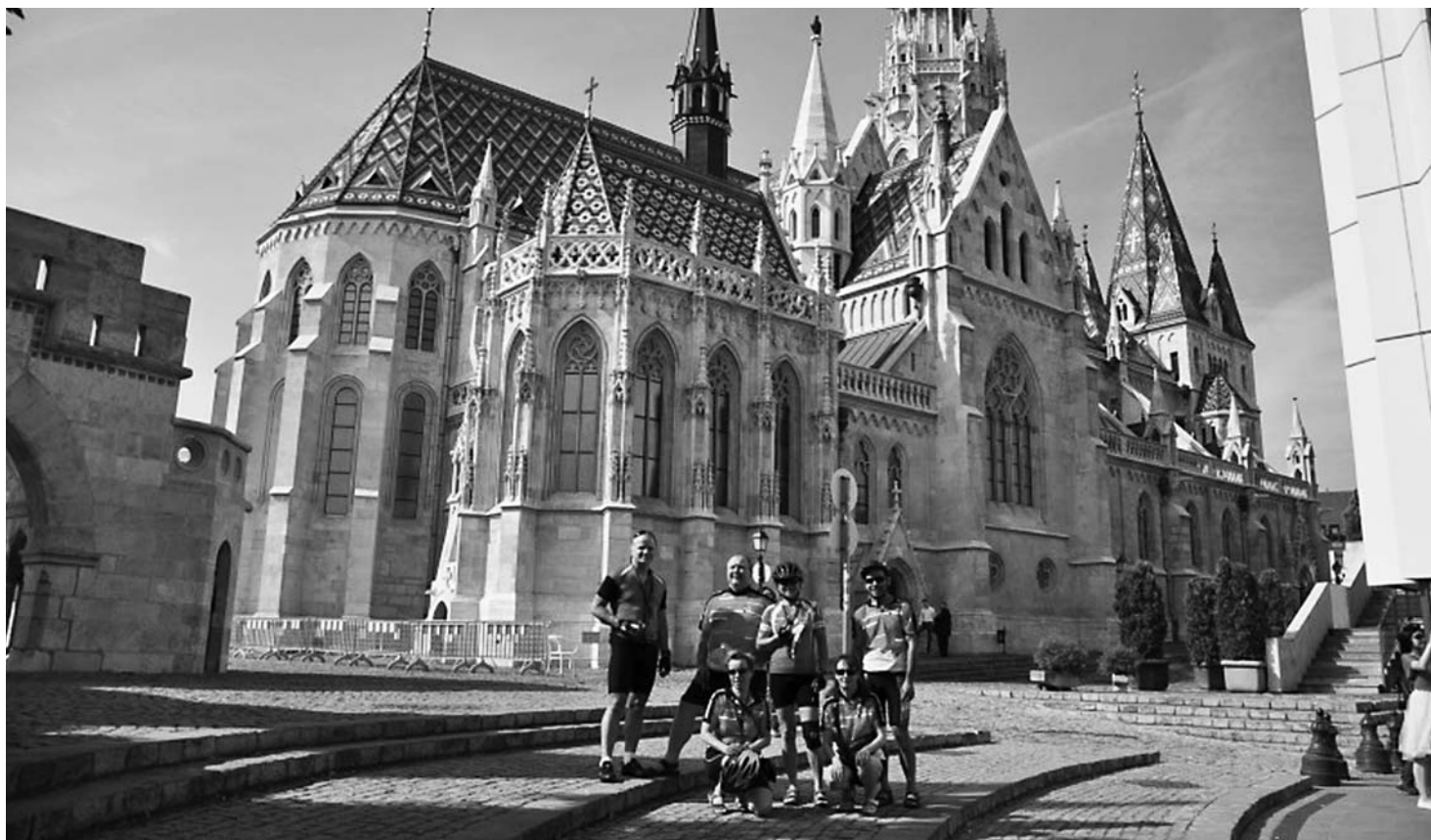
Katedra Świętego Stefana w Wiedniu.