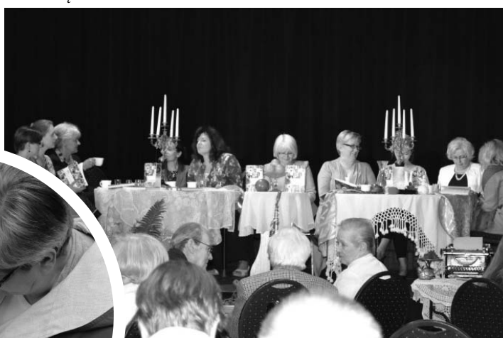
„Milanowianki” - seminarium uczestniczek projektu.