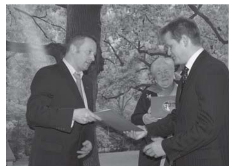
Proboszczom za błogosławieństwo spotkania wigilijnego.

Wszystkim darczyńcom, którzy pomogli św. Mikołajowi być hojnym serdecznie dziękuję. Szczególne podziękowania kieruję do tych, którzy są ze mną od zawsze. Dziękuję panu Burmistrzowi za patronat, a księżom