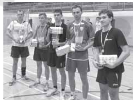
Zwycięzcy turnieju