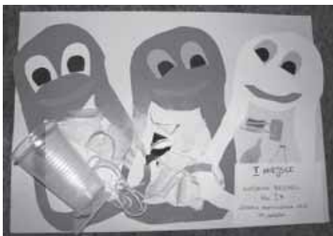
Antonina Reichel - I miejsce (SP 2)