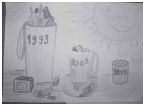
Kamil Koryciński - I miejsce (ZSG 1)