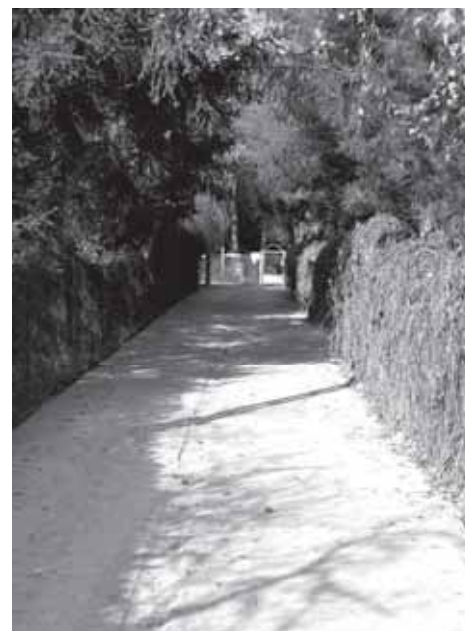
Nowy ciąg pieszo-jezdny w ul. Kruczej