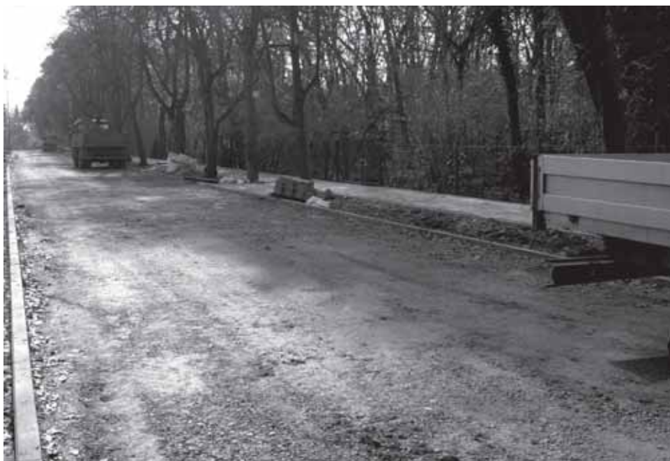
Budowa ul. Zachodniej na odcinku Słowackiego - Wielki Kąt