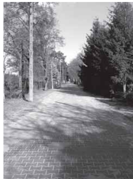
Wybudowany ciąg pieszo-jezdny w ulicy Inżynierskiej