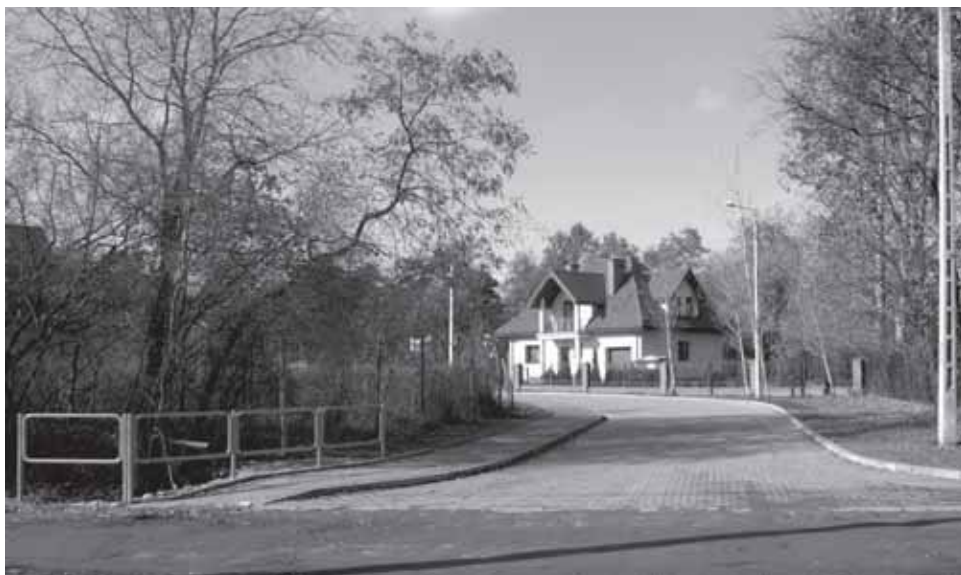
ul. Głowackiego - wybudowany odcinek Kościół-Uroczą