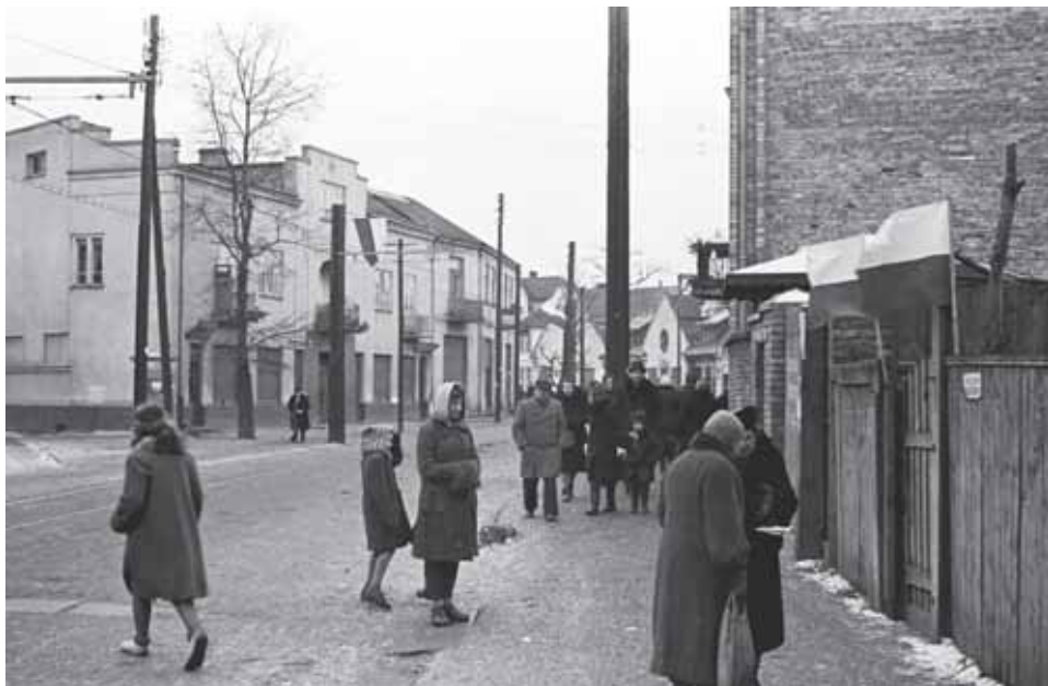
„Wyzwolenie” Milanówka, ul. Warszawska (styczeń 1945 r.)

W 1944 r. pawilon zakładu fotograficznego F. Witkowskiej miał swoje „pięć minut”. Wtedy