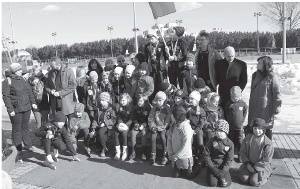
Mistrzostwa Polski Dzieci W-wa Stegny.