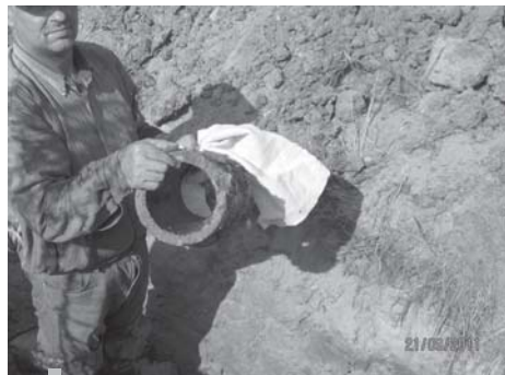
Element zbieracza sieci drenarskiej w trakcie wymiany

siły na tym polu. Wykonana koncepcja odwodnienia terenu w okolicach ulic Chopina, Moniuszki i Szczepkowskiego pozwoliła przewidzieć zakres robót niezbędnych do wykonania w ramach tej inwestycji i określić ich koszty.