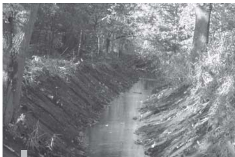
Róg Grudowski w okolicach ulicy Rososzańskiej po wykonanej konserwacji

Miasto Milanówek od początku swojego istnienia powstawało przy jak najmniejszej ingerencji w środowisko. Dlatego też można je obecnie zaliczyć do kategorii miast-ogrodów. Konsekwencją takiego sposobu rozwoju jest pozostawienie terenu w stanie jak najmniej zmienionym: większość ulic posiada nawierzchnię gruntową, a zieleń stanowi chlubę mieszkańców. Jak wiadomo, zieleń potrzebuje dużej ilości wody. Z tego powodu odwodnienie miasta było zagadnieniem drugoplanowym i pozostawało w stanie niezmienionym od dziesiątków lat. Naturalne ciekły wodne, rowy melioracyjne i drenaż pól odprowadzały nadmiar wód opadowych. Niestety rozwój zabudowy mieszkaniowej i wieloletni okres suszy spowodował degradację tego naturalnego systemu. Ostatnie lata obfitych deszczy ujawniły skalę zaniedbań. Rok 2011 stał się rokiem przełomowym w porządkowaniu gospodarki wodami na terenie miasta.