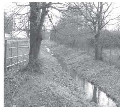
Rzeka Rokitnica po wykonanej przez WZMiUW konserwacji.

Wykonanie w 2012 roku koncepcji odwodnienia południowej części Miasta pozwoli określić potrzeby w zakresie najbardziej pilnych inwestycji usprawniających gospodarkę wodami powierzchniowymi. Powołana Spółka Wodna, jako inicjatywa mieszkańców, będzie zajmować się kwestią odtwarzania i konserwacji rowów na terenach prywatnych. Współpraca Spółki z miastem pozwoli odbudować system odwodnienia zapobiegający wielu podtopieniom i niszczeniu nieruchomości przez wody deszczowe.