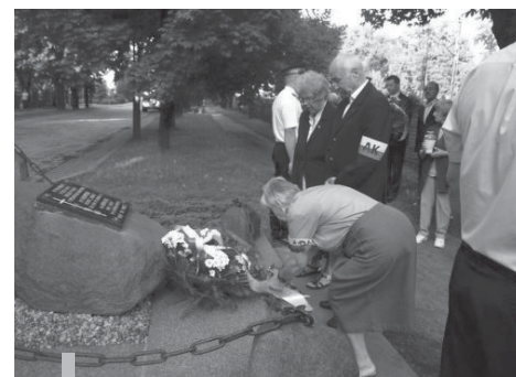
Pomnik przy ul. Krakowskiej, upamiętniający lipcowe wydarzenia