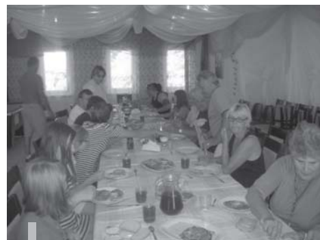
Wspólne posiłki dają poczucie bliskości i więzi z rodziną