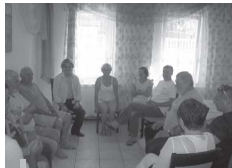
Spotkanie z terapeutą