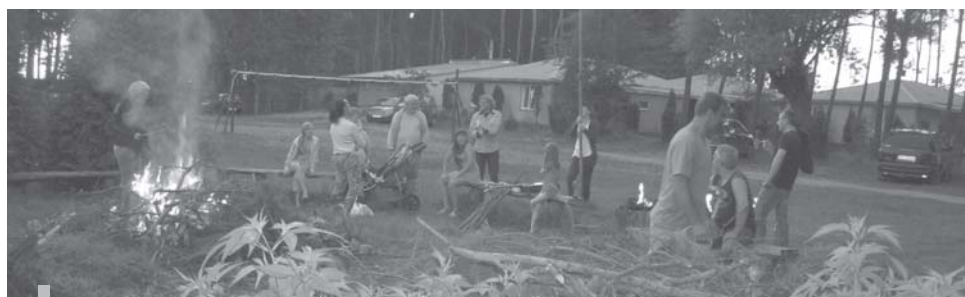
Wieczorne ogniska były też jedną z okazji do rozmowy.