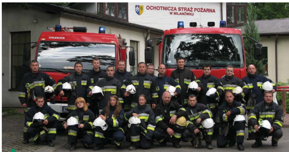
Zatoga OSP Milanówek

Uroczystie obchodzony we wrześniu br. jubileusz 100-lecia OSP Milanówek będzie jednocześnie okazją do zaprezentowania obszernej publikacji o dziejach jednostki, szczegółowo przybliżającej fakty z jej historii, lecz też będącej swego rodzaju hołdem i podziękowaniem dla wszystkich osób z nią związanych, za ich społeczną pracę i zaangażowanie.