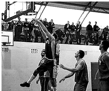
Mecz z Legią Warszawa zakończył się wynikiem 72:71; Emocjonująca końcówka meczu wszystkich postawiła na nogi