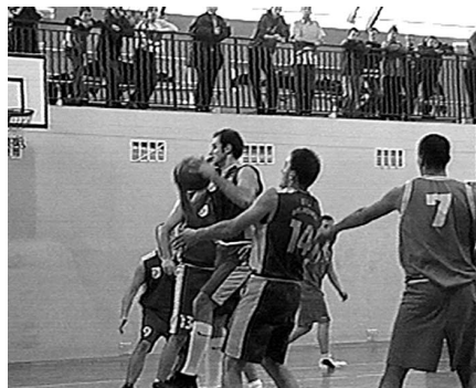
Jedna z piękniejszych akcji pod koszem Legionistów