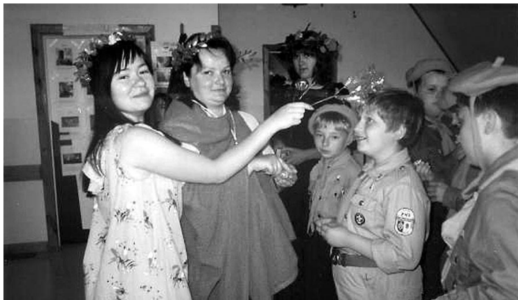
Zabawy z zuchami