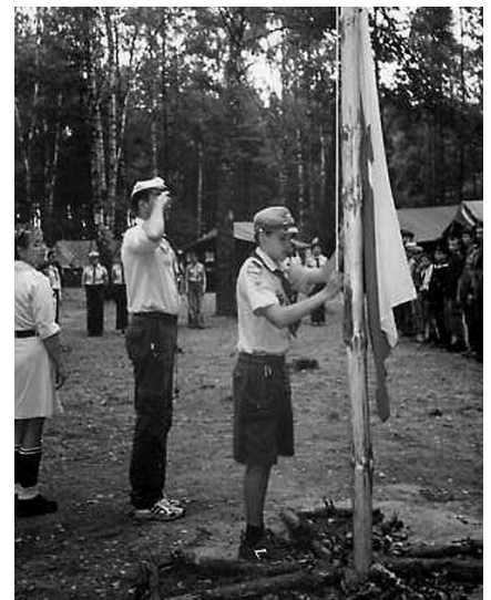
Podniesienie flagi na maszt

Na naszych letnich placówkach mieliśmy przyjemność gościć przedstawicieli władz