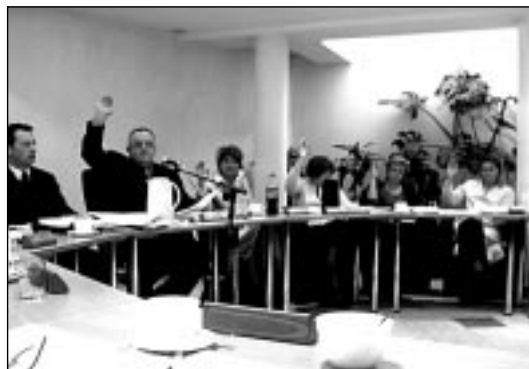
Głosowanie za udzieleniem absolutorium Burmistrzowi Miasta Milanówka

- Rozdz. 85219 – Ośrodki pomocy społecznej – niewykorzystane środki w planie po wypłacie dodatkowego wynagrodzenia rocznego przeznaczają się na pokrycie kosztów odprawy emerytalnej dla pracownika OPS-u.