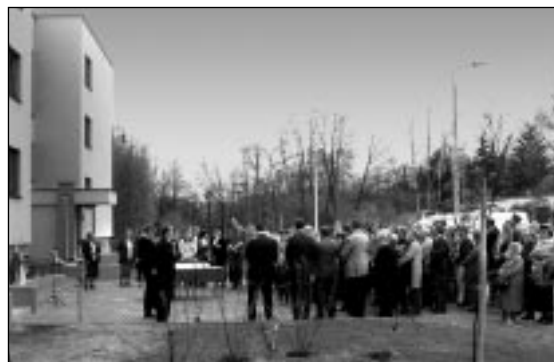
Mieszkańcy miasta i budynku TBS zgromadzeni na ceremonii otwarcia