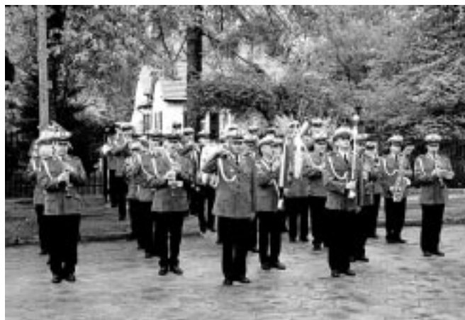
Uroczystość uświetniła Orkiestra i Kompania Reprezentacyjna Stołecznej Policji