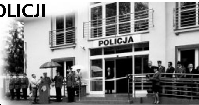
Wśród osób przemawiających był również Komendant Stołecznej Policji Ryszard Siewierski

Wraz z przekazaniem do użytku nowego Komisarjatu spełniły się kolejne obietnice przedwyborcze Burmistrza J. Wysockiego i milanowskich radnych. Po rozbudowie pomieszczeń Ochotniczej Straży Pożarnej i wyposażeniu w dwa nowoczesne wozy bojowe, po oddaniu do użytku zmodernizowanej siedziby Straży Miejskiej w zabytkowym budynku dawnej stacji PKP (i po przekazaniu jej nowego samochodu patrolowego), przyszła kolej na