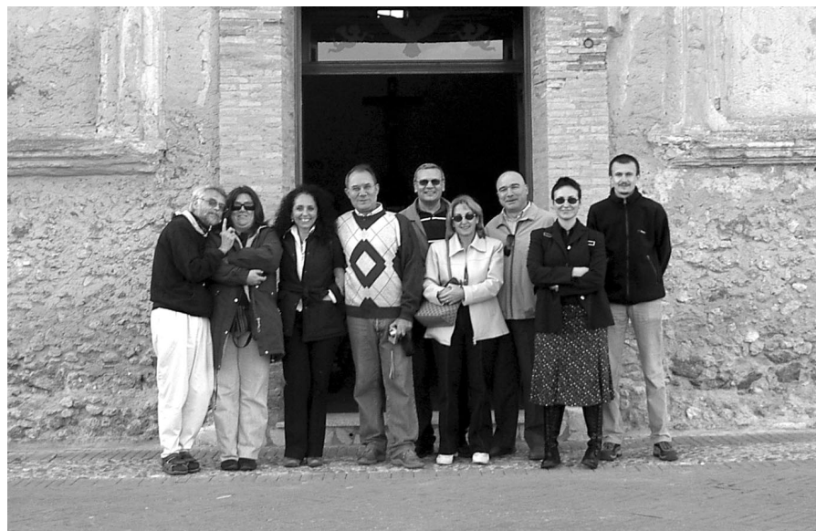
Uczestnicy projektu Europoint przed XIII-wiecznym kościołem w Vibo Valentia

Co się dzieje w przypadku, kiedy jest wielu chętnych?