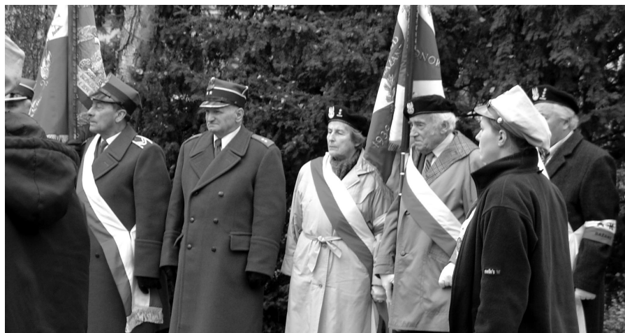
Od lewej: Poczet Sztandarowy Związku Kombatantów Rzeczypospolitej Polskiej i Byłych Więźniów Politycznych oraz Poczet Sztandarowy Światowego Związku Żołnierzy Armii Krajowej Srodowisko Mielizna Obwód Bażant