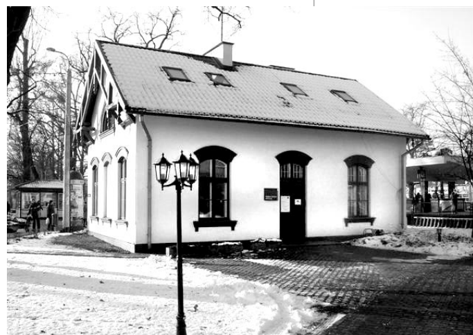
Budynek, w którym mieści się Komenda Straży Miejskiej i Miejskie Centrum Informacji

05-822 Milanówek, ul. Warszawska 32 tel. (0 22) 499 48 70, fax (0 22) 499 48 71 e-mail: mci@milanowek.pl www.milanowek.pl