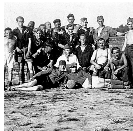
Wspólne zdjęcie drużyny polskiej i węgierskiej na boisku Jedwabnik