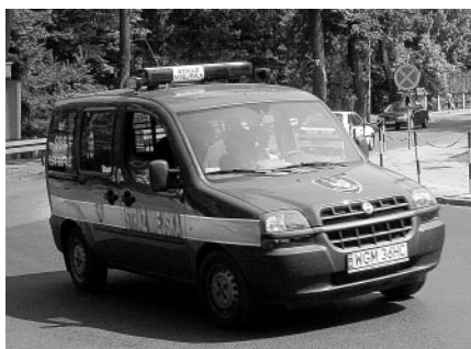
Samochód Straży Miejskiej podczas patrolu

1 listopada zabezpieczano ruch pojazdów i pieszych w rejonie cmentarza. Jedną z cięższych służb w roku. Nie wszyscy odwiedzający groby najbliższych chcą stosować się do czasowej organizacji ruchu i poleceń strażników i policjantów mających na celu zapewnienie płynności przejazdu.