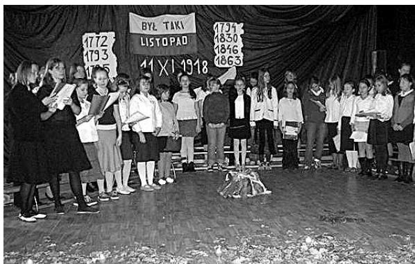
Uczniowie ZSG nr 3 podczas występów z okazji obchodów Narodowego Święta Niepodległości

Rzecznik prasowy ZSG nr 3 Katarzyna Drzewiecka