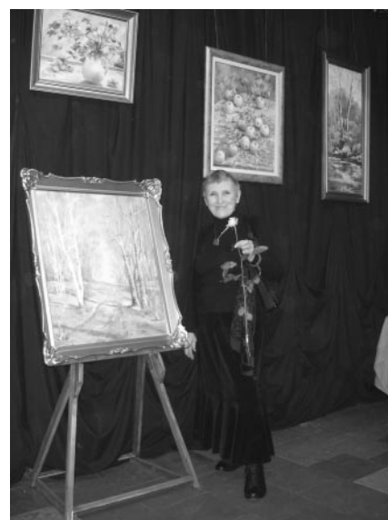
Nastrojowe malarstwo Niny Gąsowskiej