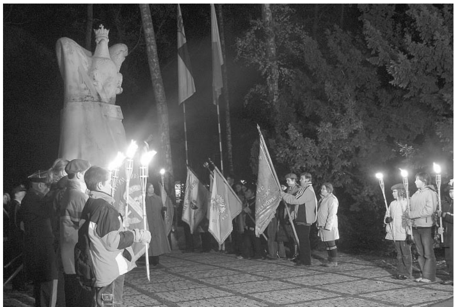
Poczty Sztandarowe oraz harcerze z pochodniami przed Pomnikiem Bohaterów