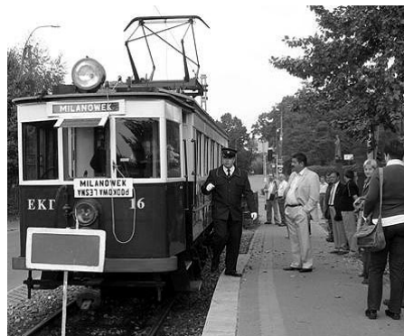
Maszynista w stroju z epoki i wagon EKD z 1927 r.; pociągi tego typu wozili pasażerów w latach 1927-1971

1 października br., w Miejskim Ośrodku Kultury odbyły się obchody 70-lecia uruchomienia linii EKD/WKD w Milanówku.