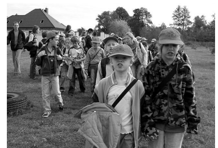
Uczestnicy złazu turystycznego „Babie Lato 2006”