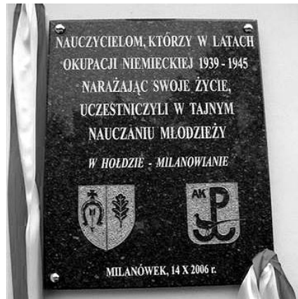
Tablica upamiętniająca nauczycieli uczących na tajnych kompletach w czasie II wojny

Uroczystości rozpoczęły się Mszą Świętą odprawioną w kościele parafialnym pod wezwaniem świętej Jadwigi. Nabożeństwo miało szczególnie uroczysty wymiar także ze względu na asystę Kompanii Honorowej 9 Pułku Dowodzenia Dowództwa Wojsk Łą-