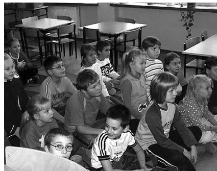
Dzieci z zainteresowaniem słuchają Burmistrza czytającego im książkę