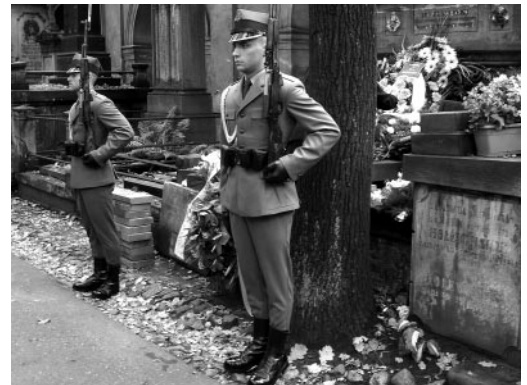
Uroczystości pogrzebowe Hanny Mickiewiczowej na Powązkach w asyście Warty Honorowej