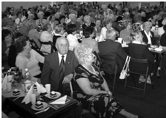
Licznie zgromadzeni na uroczystości 60-lecia emeryci, renciści i zaproszeni goście

Program uroczystości jest bogaty, inauguruje go godzinny występ Zespołu Pieśni i tańca „Mazovia” z Płocka, który prezentuje piękne polskie tańce i pieśni ludowe, gorąco oklaskiwany przez zgromadzoną publiczność.