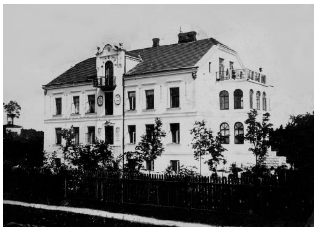
Budynek gimnazjum przy ul. Spacerowej (willa „Bożenka”) z okresu dwudziestolecia międzywojennego

Nasza wiedza jest jednak niepełna. Nie ujmując zasług autorom, wspomniana wcześniej lista nauczycieli uczestniczących w tajnym nauczaniu zawiera luki. Brak pełnej wiedzy o tajnym nauczaniu w Szkole nr 1 i Szkole nr 2. Nie wiemy, czy i co działo się w tym zakresie w Prywatnej Szkole Powszechnej. Trudno jest uwierzyć w ustne relacje uczniów tej szkoły, że nic się tam nie działo. Musiały być stosowane jakieś inne metody, bo o brak patriotyzmu i odwagi nauczycieli tej szkoły, takich jak choćby pani