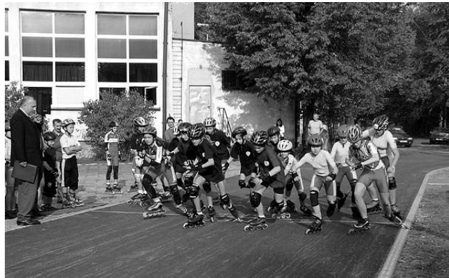
Młodzi sportowcy testują nowo powstały tor wrotkarski

stwem Miłośników Milanówka, Pracownią Projektu i Stylizacji Sylwetki BEFANA i środowiskiem muzyków z dawnego zespołu Trapistów, obecnie Pokoju Znak. Wśród urodzinowych prezentów jest aparat fotograficzny – dar Starostwa Grodziskiego, tablica pamiątkowa ufundowana przez władze Miasta, album Dzieje Świata подарowany przez Integracyjną Społeczną Szkołę Podstawową nr 18. Ponadto gratulacje przesłały dyrekcje szkół i Archiwum Państwowego Dokumentacji Osobowej i Placowej. Ważnym punktem uroczystości było wręczenie nagród i podziękowań nauczycielom i pracownikom szkoły z okazji Dnia Edukacji Narodowej.