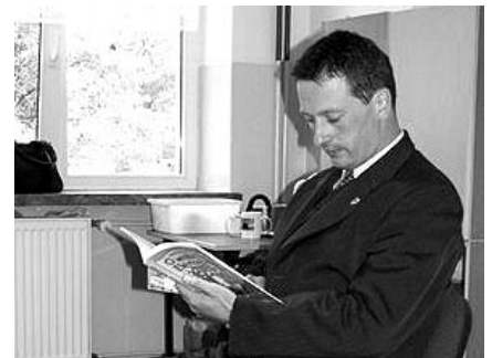
Burmistrz w Szkole nr 3 był wiele razy, lecz po raz pierwszy jako lektor

Dziękujemy bardzo Panu Burmistrzowi, a lubiących czytać rodziców, rodzeństwo oraz