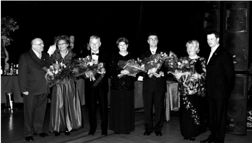
Laureaci IV Edycji Milanowskiego Liścia Dębu w towarzystwie Ojców Miasta