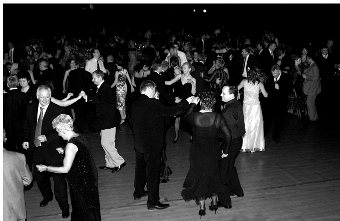
Wspaniała zabawa podczas VII Balu Ojców Miasta