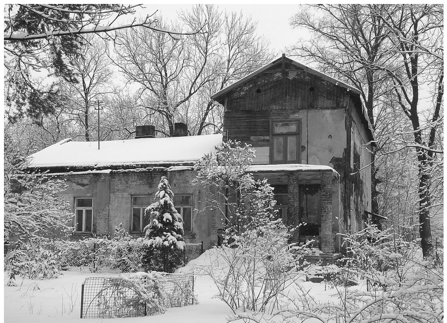
Wiele pięknych willi w Milanówku wymaga gruntownej rewitalizacji

Specjalista ds. Unii Europejskiej Tomasz Świebocki