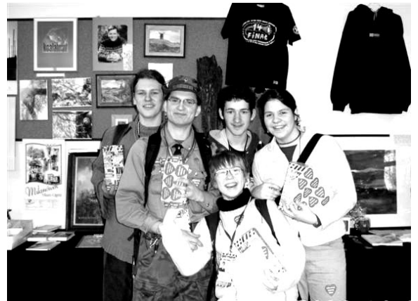
Wolontariusze gotowi do zbierania pieniędzy; W tle przedmioty przeznaczone na finałową licytację