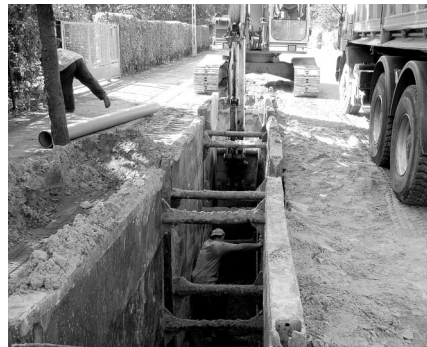
Prace przy budowie kanalizacji w ulicy Podleśnej

Ulica Podleśna (Wspólna-Leśny Ślad), Niska, Południowa i Zakątek.