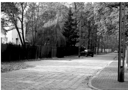
Ulica Grabowa w rejonie ul. Piłsudskiego – nawierzchnia z trylinki i chodnik

Ulica Grabowa – nawierzchnia z trylinki i chodnik (Piłsudskiego-Okólna).