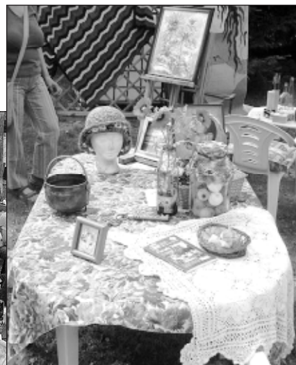
Wyroby rękodzielnicze zaprezentowane podczas pierwszego spotkania

Zakończenie warsztatów nastąpi 16 września w trakcie Otwartych Ogrodów.