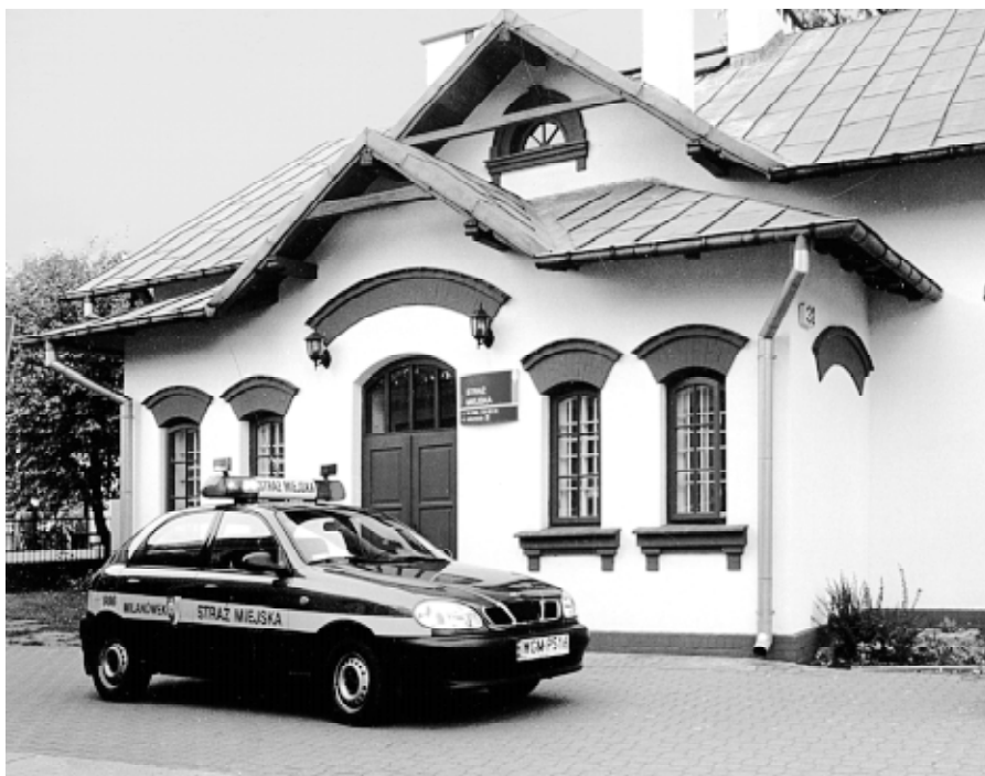
Siedziba Straży Miejskiej przy ul. Warszawskiej 32

30 lipca , godz. 13.20 na ul. Krakowskiej ukarano mandatami dwóch kierowców parkujących w miejscu obowiązywania