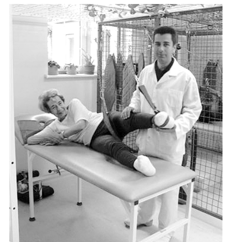
Zabieg fizykoterapii wykonywany w nowo otwartej przychodni rehabilitacyjnej