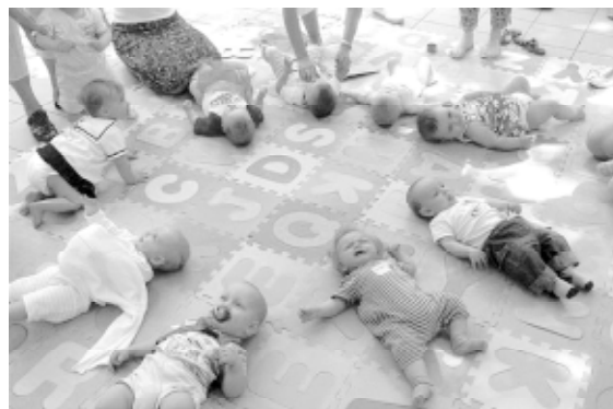
Maluchy i ich mamy w trakcie zajęć

płatnie Miejski Ośrodek Kultury. Na pierwsze zajęcia zgłosiło się 12 pań ze swoimi pociechami. Niemowlakom program się spodobał, a Mamy miały okazję do poznania się, zaczęły się nawet umawiać poza zajęciami, co oznacza, że integracyjny cel Klubu również został osiągnięty. Mamy nadzieje, że zajęcia wpiszą się na stałe w życie Milanówka i okolic. Już teraz przyjeżdżają mamy z Grodziska i Podkowy Leśnej.