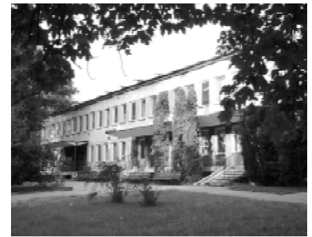
Budynek przychodni przy ul. Piasta