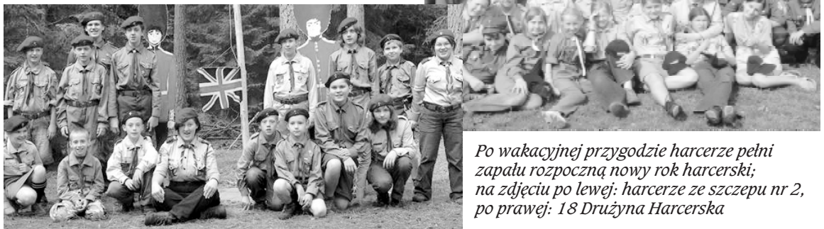
Po wakacyjnej przygodzie harcerze pełni zapału rozpoczną nowy rok harcerski; na zdjęciu po lewej: harcerze ze szczepu nr 2, po prawej: 18 Drużyna Harcerska

Dziękuję wszystkim instruktorom, całej kadrze kolonii, obozów i zlotu, za wolontariacką pracę, a przede wszystkim za serce, pomysły i zaangażowanie w sprawne poprowadzenie naszych placówek, a wszystkim zuchom i harcerzom dziękuję za uśmiech i harcerską postawę.