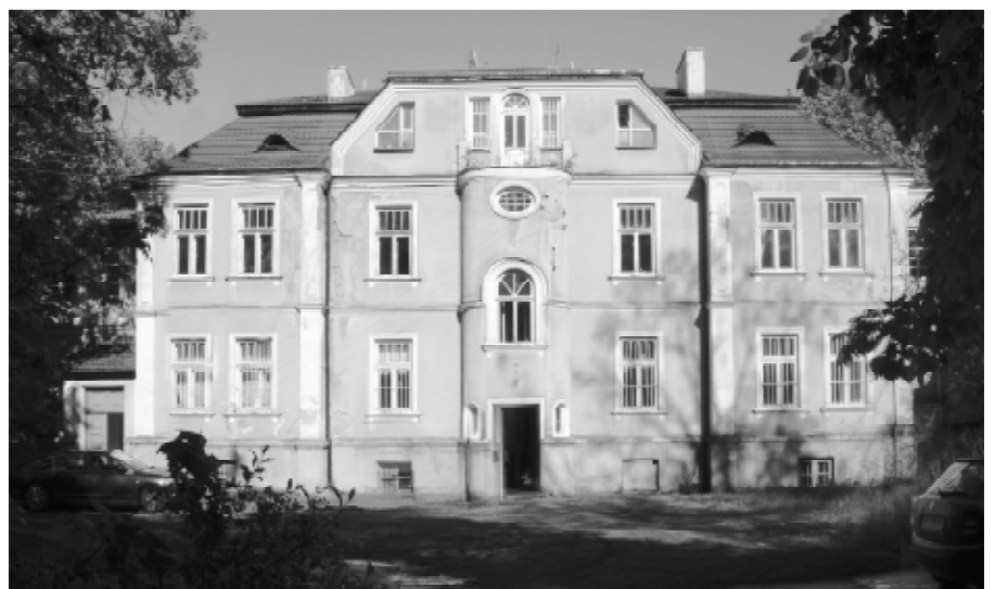
Willa „Waleria”, widok od strony zachodniej

Po zapoznaniu się z powyższą ekspertyzą, został ogłoszony otwarty konkurs na opracowanie założeń koncepcji programowo-przestrzennej zagospodarowania „Walerii” i w celu wyłonienia najlepszej propozycji zgodnie z § 1 ust. 2 Uchwały Nr 36/V/2007