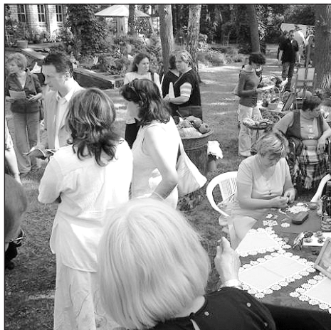
Uczestnicy warsztatów „Powrót do tradycji”

W trakcie warsztatów, twórcy z Milanówka będą prezentować swoje wyroby, a przede