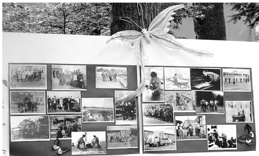
Archiwalne zdjęcia osób związanych z jedwabiem milanowskim