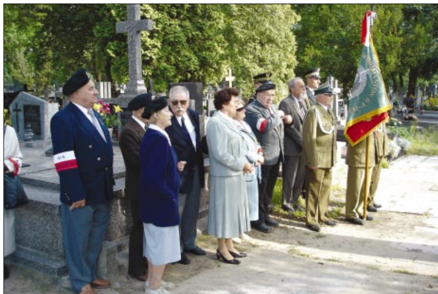
Złożenie kwiatów i zapalenie zniczy przy kwaterach Powstańców Warszawskich na miejscowym cmentarzu