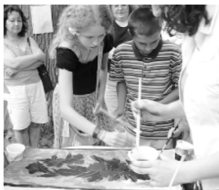
Warsztaty malowania na jedwabiu – zajęcia dla dzieci

wystawę. Wszyscy wspólnie uświadomiliśmy sobie ile tego jest, jak bardzo są to cenne i unikatowe pamiątki, które powinny się znaleźć w muzeum jedwabiu milanowskiego.