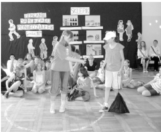
Parodia zebrania samorządu szkolnego w wykonaniu uczniów klas IV-VI SP nr 2