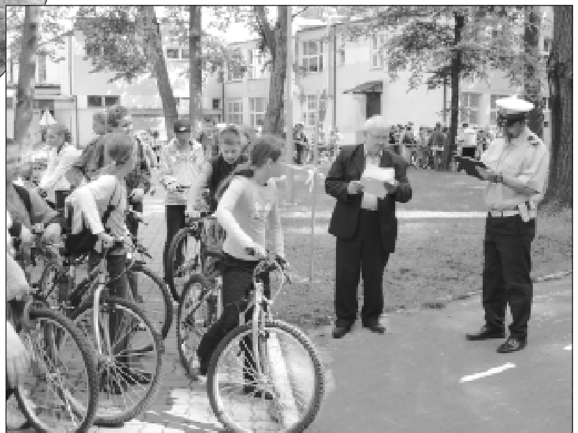
W kolejce do egzaminu praktycznego z jazdy na kartę rowerową

Wśród widowni, po przeprowadzonym konkursie