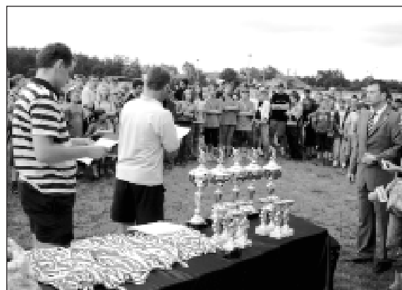
Po wielu tygodniach zmagania dzieci i młodzieży Milanówka w piłce nożnej, 18 czerwca 2007 r. przyszedł czas rozdania nagród dla najlepszych drużyn