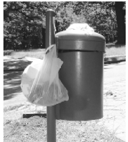
Kosz uliczny na skrzyżowaniu ul. Mickiewicza i Starołęby

Jednocześnie zwracamy się z prośbą do mieszkańców, aby będąc świadkami podrzucania odpadów, nie pozostawali obojętni na tego rodzaju działania. Może gdy wspólnie będziemy walczyć z tym proble-