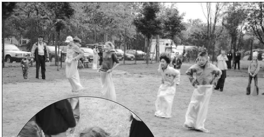
Podczas Święta Truskawki zorganizowano dzieciom wiele atrakcji; na zdjęciu uczestnicy wyścigu w workach

Nie zabrakło truskawkowych smakołyków: świeżych truskawek, ciasteczek i lodów truskawkowych oraz innych słodczy.