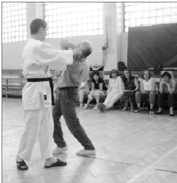
Zajęcia praktyczne w czasie szkoleń z samoobrony