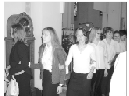
Wychowankowie ośrodka dla niewidomych w Laskach podczas wizyty w parafii św. Jadwigi (2006 r.)