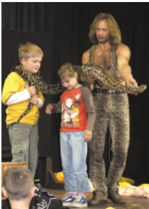
Występ fakira wzbudzał niesamowite emocje

Jedną z atrakcji imprezy był występ fakira, który zabawiał małych gości wspaniałymi, prawie niemożliwymi do wykonania