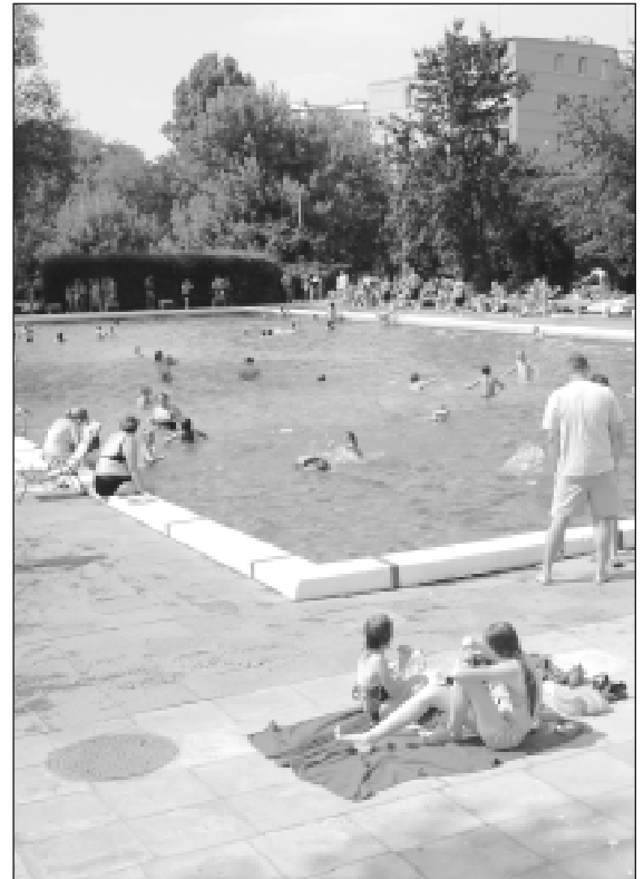
Kąpielisko miejskie w Milanówku