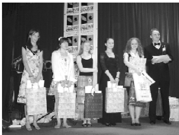
Laureaci Ogólnopolskiego Konkursu Wokalnego im. Stanisława Gruszczyńskiego po otrzymaniu nagród