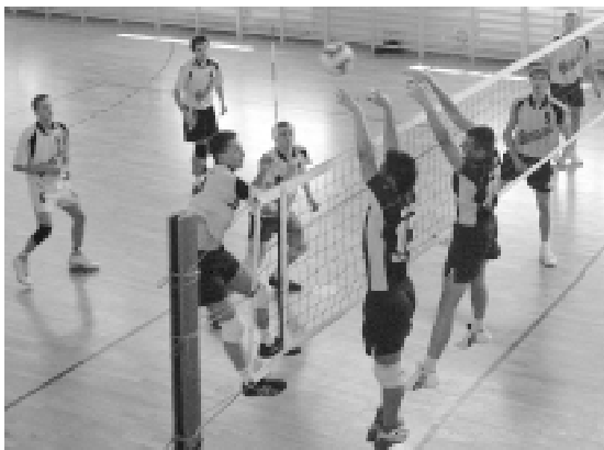
Zawodnicy podczas rozgrywek