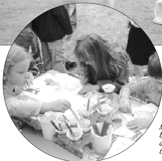
Mimo dżdżystej pogody, było twórczo i wesoło, a cała radość okraszona była truskawkami do woli