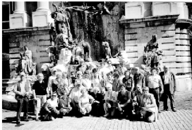
Uczestnicy wycieczki w Budapeszcie

jest piękniejsze miejsce na ziemi, gdzie Stworzyciel zgromadził wszystkie cuda tej ziemi. Docieraliśmy wodą i łądem do tych wszystkich najpiękniejszych miejsc, które nam pokazano. Wspinaliśmy się na wzgórce Medziugorie, aby modlić się do Cudownej Matki Boskiej w skupieniu i godności, bo poszliśmy tam z intencjami i modlitwami.