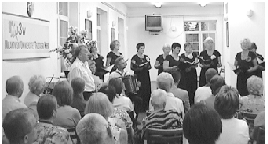
Występ zespołu wokalnego „Viva la musica” z Grodziska Maz.

W maju br. MU3W przystąpił do konkursu grantowego Polsko-Amerykańskiej Fundacji Wolności dla Uniwersytetów Trzeciego Wieku. Grant został nam przyznany i za uzyskane pieniądze będziemy realizować nasz program o nazwie „Całe życie jest szkołą”.