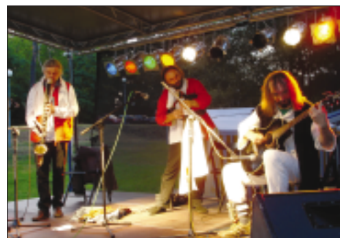
Kwartet YORGI podczas występu w amfiteatrze