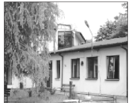
Budynek OSP z przychodnią rehabilitacyjną