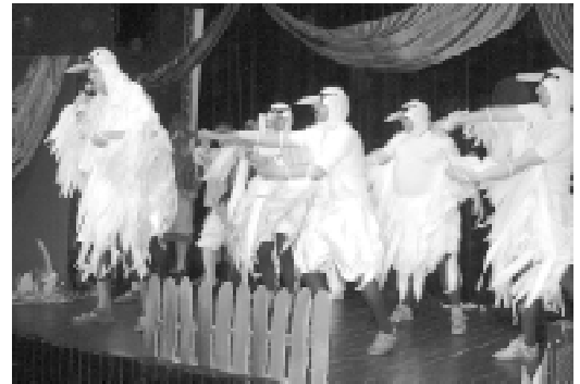
Główną atrakcją było przedstawienie „Brzydkie Kaczątka”, które odbyło się na scenie Miejskiego Ośrodka Kultury w Milanówku, a pod koniec czerwca również w MOK w Podkowie Leśnej

Członkowie Stowarzyszenia „Słoneczny Promyk” i Siostry Urszulanki SJK