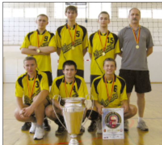
Reprezentanci Zespołu Szkół nr 1, którzy osiągnęli wielki sukces