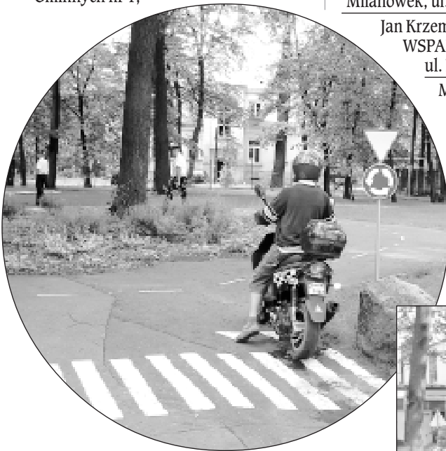
Motorowerzysta podczas egzaminu na kartę motorowerową w miasteczku ruchu drogowego