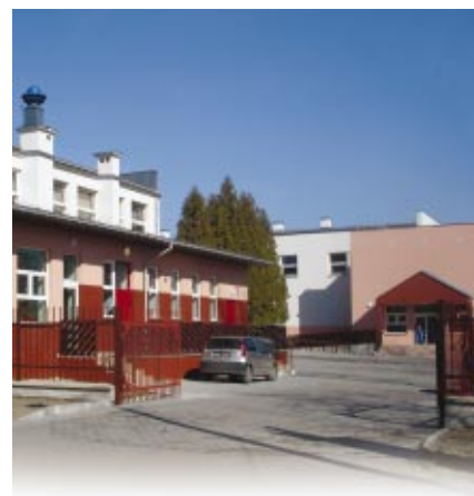
Centrum Sportu i Rekreacji „Grudów” jest już w fazie ukończenia

Dyrekcja, Rada Pedagogiczna, Rodzice i Uczniowie ZSG nr 1