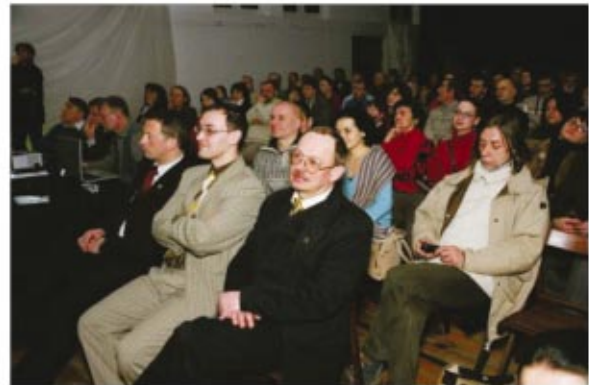
Licznie zgromadzona publiczność. Na pierwszym planie oficjalni goście z Lidzbarka Warmińskiego — partnerskiego miasta Milanówka.

pozyskiwanych za pomocą misji astronautycznych źródłem informacji o materii pozaziemskiej są właśnie meteoryty.