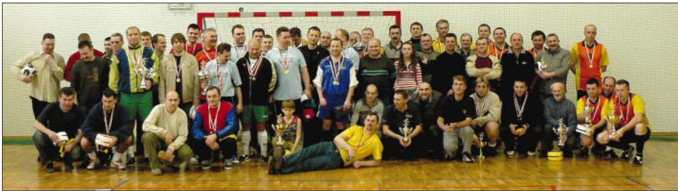
Pamiątkowe zdjęcie na zakończenie rozgrywek Ligi Oldbojów