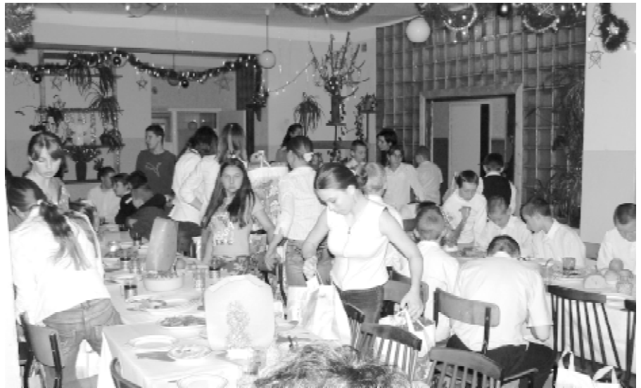
Tak wyglądał wigilijny wieczór w Ośrodku Szkolno-Wychowawczym w Żyrardowie, m.in. dzięki zaangażowaniu wielu milanowskich serc

Poza opisaną Gwiazdką, która była uwieńczeniem rocznej pracy Stowarzyszenia, opłacaliśmy obiady dziesięciorgu dzieciom w 3 milanowskich szkołach, wspomogliśmy finansowo 3 osoby, które znalazły się w ciężkich warunkach, a także ponad 50 osób otrzymało odzież. Były to przeważnie osoby skierowane przez OPS lub parafie, a także zgłaszające się indywidualnie. Ponadto wspomagaliśmy finansowo i rzeczowo ośrodek dla dzieci niewidomych w Laskach, świetlicę sportową na Turczynku oraz