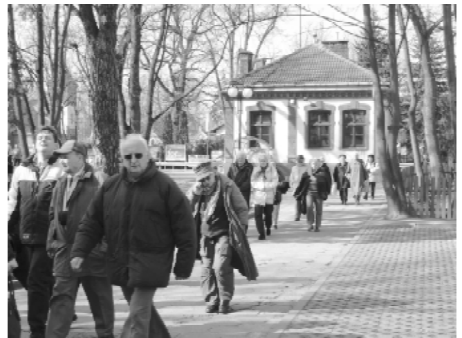
Czytelnicy „Życia Warszawy” podczas zwiedzania naszego miasta w ramach „Spacerów z Syrenką”