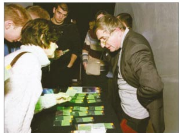
Po imprezie nie brakowało chętnych na zakup małego „kosmity”.

Przedruk z kwartalnika „Meteoryt” 1/2007 (więcej informacji na stronie www.milanowek.pl )