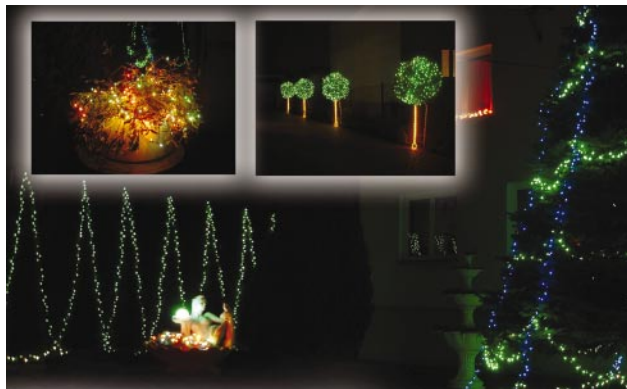
Oświetlenie świąteczne na Nadarzyńskiej 35 – w prostokątach od lewej na górze – fragmenty dekoracji

W dniu 17 stycznia 2007 w godzinach 16.00 - 19.00 Komisja dokonała oceny obiektów zgłoszonych do konkursu na „Najpiękniejsze oświetlenie świąteczne 2006 r.”