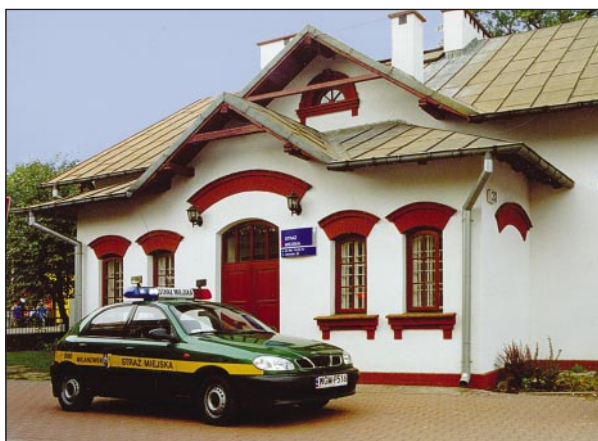
Samochód patrolowy Straży Miejskiej

2.XII. Ukaraliśmy mandatem mężczyznę pijącego alkohol na schodach wiaduktu od strony ul. Warszawskiej