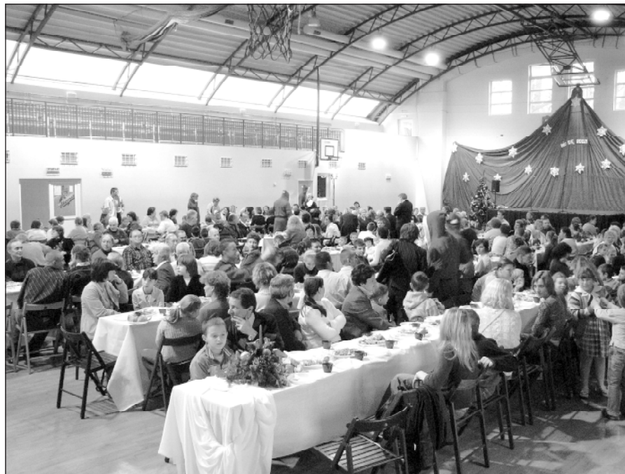
Spotkanie wigilijne odbyło się 21 grudnia 2006 r. w Miejskiej Hali Sportowej w Milanówku