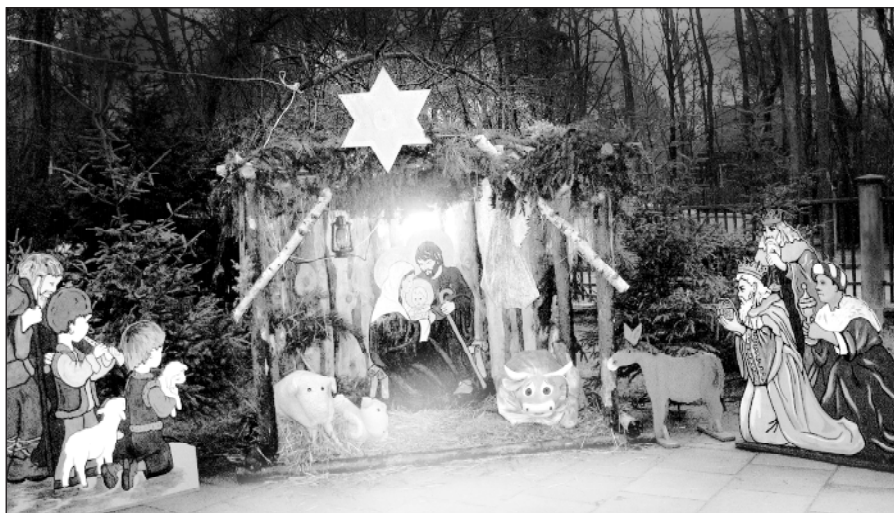
Bożonarodzeniowa szopka przy Szkole Podstawowej nr 2 wykonana przez społeczność szkolną

Dyrektor Szkoły Podstawowej nr 2 Marianna Frej