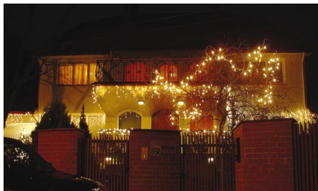
Oświetlenie świąteczne na Wiejskiej 3