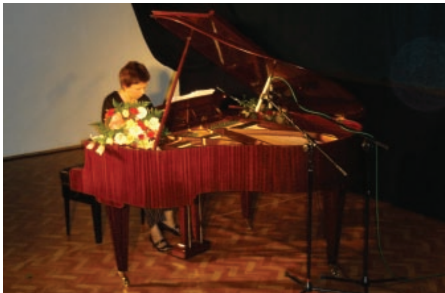
Koncert w wykonaniu znanej pianistki, kompozytorki i jazzmanki Leny Ledoff

Dnia 22 lutego, w rocznicę śmierci Fryderyka Chopina, w sali Teatru Letniego Miejskiego Ośrodka Kultury w Milanówku odbyła się uroczystość inaugurująca obchody 200. rocznicy urodzin i 160. rocznicy śmierci wielkiego kompozytora pod nazwą: Chopin w Milanówku - Europejskie Spotkania Muzyczne.