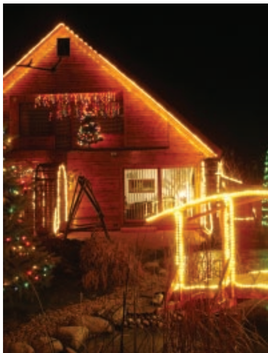
Andrzej Kwaczyński, ul. Szkolna 21 (III miejsce)