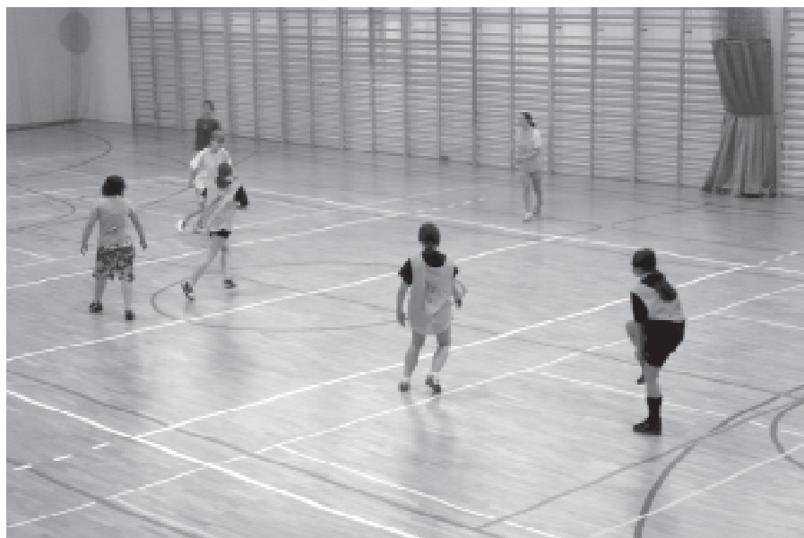
Rozgrywki sportowe w Miejskiej Hali Sportowej nr 1 podczas akcji „zima w mieście”

Trzeba jechać w góry, aby miło spędzić czas, uprawiać sport..., zobaczyć śnieg. Co do śniegu - zgoda! Ale co do mile spędzonego czasu, uprawiania sportu - niekoniecznie!