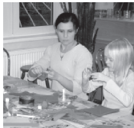
Zajęcia w ramach warsztatów plastycznych