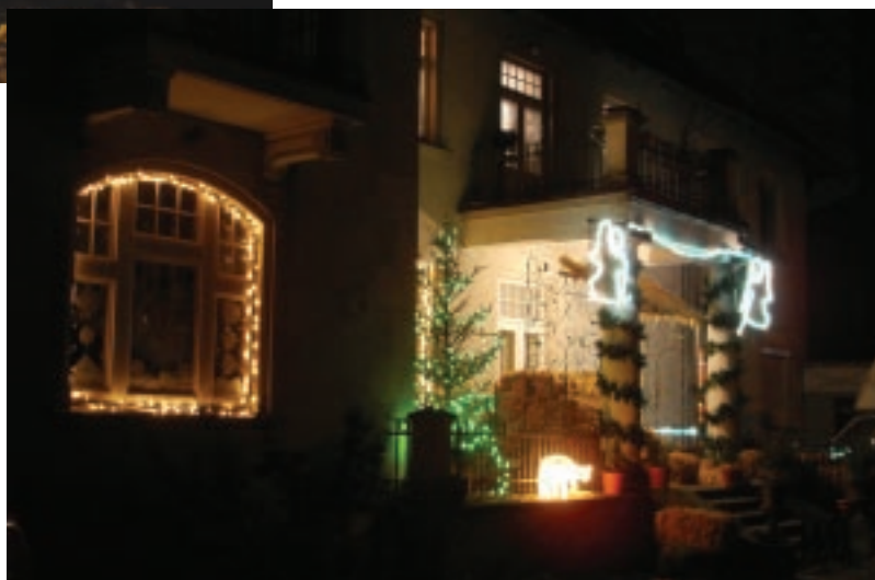
Ogród Truskawkowego Przedszkola przy ul. Warszawskiej 52 (II miejsce)