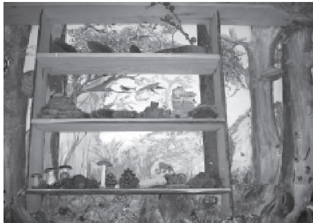
Wykonane przez uczniów malowidła ścienne w pracowni przyrodniczej

Największe zaangażowanie i zapał towarzyszył uczniom na zajęciach plastycznych. Pod fachowym okiem nauczycielki przyrody i z wykorzystaniem fachowej literatury uczniowie poznawali życie, środowisko i zwyczaje zwierząt, funkcjonowanie ekosystemów. Następnie zdobyte informacje wykorzystywali w konkretnej pracy plastycznej, którym było malowanie i ozdabianie ścian pracowni - kontynuowanie podjętego kilka lat temu i co rok rozwijanego projektu przyrodniczej ścieżki dydaktycznej. Budowana przez lata ścieżka ma swój początek w pracowni w formie malowideł ścien-