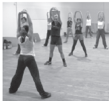
Zajęcia w ramach aerobiku