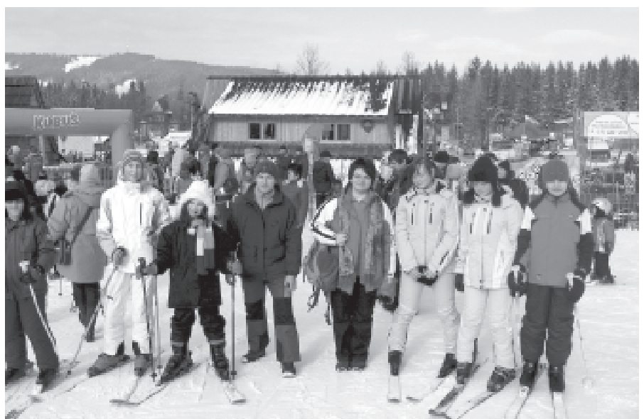
Za chwilę sprawdzian narciarskich umiejętności