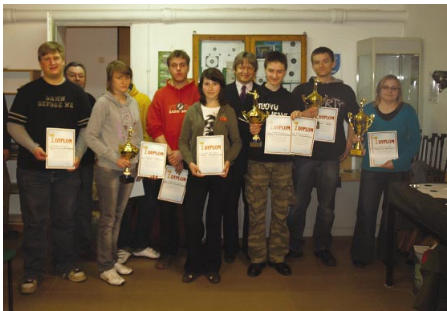
Zwycięzcy I Powiatowych Zawodów Szkół Średnich w strzelectwie

3 kwietnia na strzelnicy pneumatycznej, w budynku Zespołu Szkół nr 1 przy ul. Piasta 14, odbyły się I Powiatowe Zawody Szkół Średnich w strzelectwie, które zgromadziły niespodziewanie dużą liczbę uczestników. Sport ten cieszy się ostatnio coraz większą popularnością, jak widać nie tylko w naszym mieście.