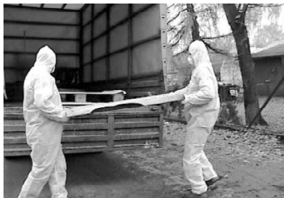
Odbiór eternitu od mieszkańca Milanówka

Zainteresowanych mieszkańców zapraszamy do Referatu Ochrony Środowiska, w celu podania szacunkowej ilości eternitu (w kg) oraz wypełnienia deklaracji partycypowania w kosztach (w 40%) odbioru i utylizacji tego odpadu.