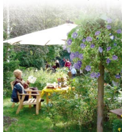
Otwarte Ogrody w Milanówku