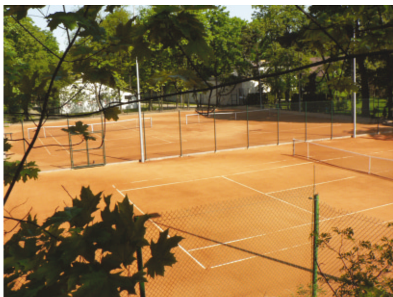
Zapraszamy do korzystania z „nowych” kortów tenisowych