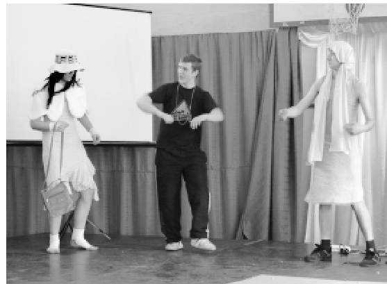
Kabaret w wykonaniu chłopców z kl. 1a Liceum Ogólnokształcącego

W tym dniu nie mogło zabraknąć śpiewu – uczniowie wystąpili w konkursie Karaoke przygotowanym przez klasę I a LO (wych.