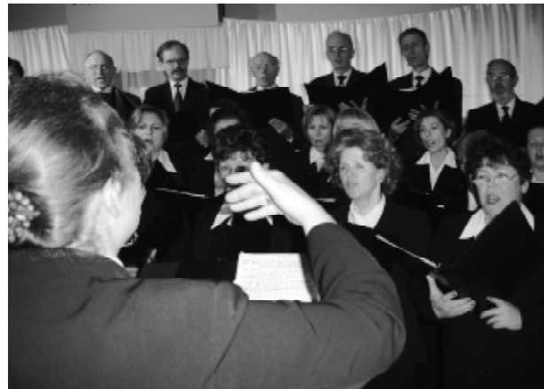
Chór Lacrimosa podczas jednego z koncertów

Do sukcesów zespołu przyczynili się także sympatycy, którzy wspierają chór nie tylko swoją zwykłą życzliwością, ale wiele razy byli