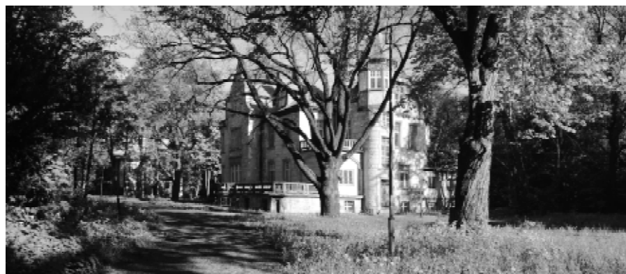
Zespół parkowo-ogrodowy „Turczynek” w Milanówku przy ul. Brwinowskiej