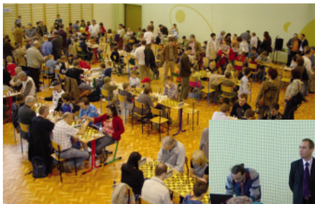
Uczestnicy mistrzostw podczas rozgrywek