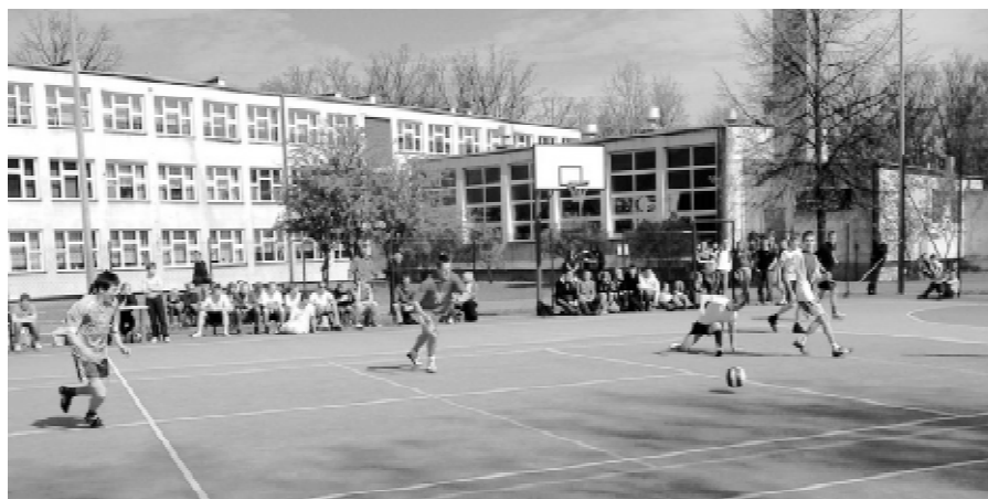
Rozgrywki sportowe na boisku szkolnym

„Dni...” rozpoczęły się we wtorek, 29 kwietnia, rozgrywkami sportowymi. Wzięli w nich udział uczniowie trzecich klas gimnazjalnych oraz uczniowie klas pierwszych z „Bema”.