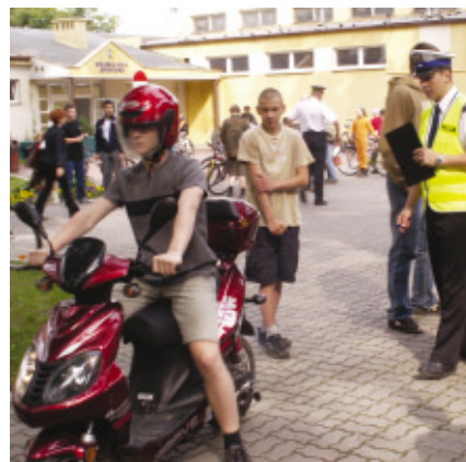
Tak było w poprzednich latach

Kontynuując kilkuletnią tradycję organizowania dla milanowskiej szkolnej społeczności współzawodnictwa w zakresie poprawy bezpieczeństwa dzieci i młodzieży, rów-