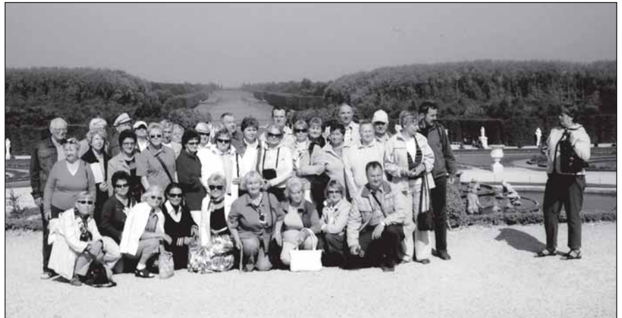
Uczestnicy wycieczki w ogrodach Wersalu

W tym roku postanowiliśmy DZIEŃ SENIORA zorganizować trochę inaczej niż to było do tej pory, a mianowicie postanowiliśmy, że spotkania z tej okazji odbywać się