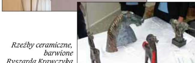
Rzeźby ceramiczne, barwione Ryszarda Krawczyka