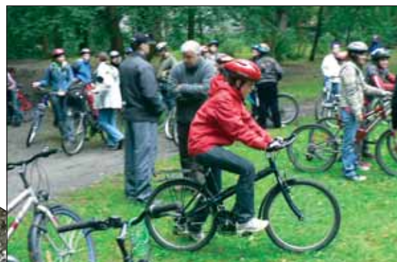
Przygotowania do startu