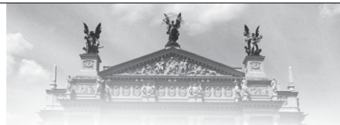
Fronton gmachu Opery Lwowskiej