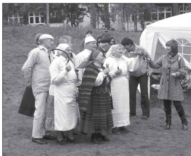
Goście z Muzeum Wsi Radomskiej zabawiali publiczność regionalnymi przyśpiewkami