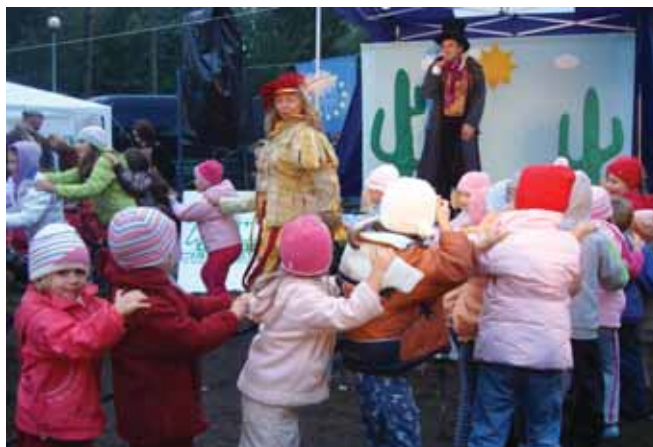
Dzieci chętnie brały udział w zabawach zorganizowanych w ramach „Grządki”