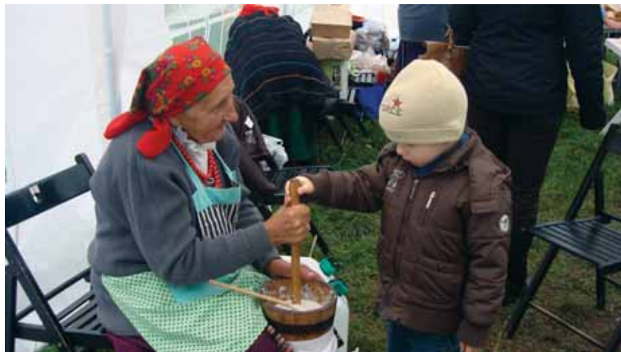
Obrzędy i tradycje polskiej wsi zaprezentowane przez przedstawicieli Muzeum Wsi Radomskiej w ramach EDD