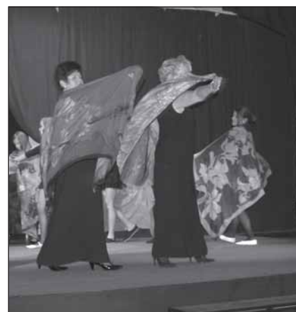
Malarstwo na jedwabiu zostało zaprezentowane poprzez wyjątkowy pokaz mody

Malarstwo na jedwabiu zostało zaprezentowane poprzez wyjątkowy pokaz mody. Modelki owinięte w jedwabie, ruchem ciała i swoją gracją doskonale ukazały piękno tych delikatnych prac malarskich. Dzieła te ożyły i ich wymowa nabrała innego wymiaru. Dziewczeta należące do grupy tańca nowoczesnego CKiP prowadzonego przez Joanną Kazikowską, doskonale dały sobie radę w trudnej roli modelek, za co im serdecznie dziękujemy.