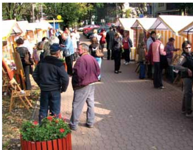
Mieszkańcy miasta mieli okazję podziwiać prace rękodzieła artystycznego podczas kiermaszu zorganizowanego w ramach programu „MILA”

Ośrodek Pomocy Społecznej w Milanówku w dniach 13 i 27 września oraz 11 października b.r. realizował, w ramach Programu Operacyjnego Kapitał Ludzki – „MILA” Milanowska Inicjatywa Lokalnej Aktywności, cykl imprez pod hasłem „Jesień w Jedwabnym Milanówku”.