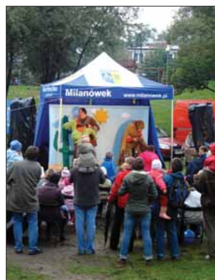
Prezentacja „Wędrowka małej chmurki” wzbudziło zachwyt nie tylko wśród dzieci

Biuro Koordynacji Prac Artystycznych CKiP