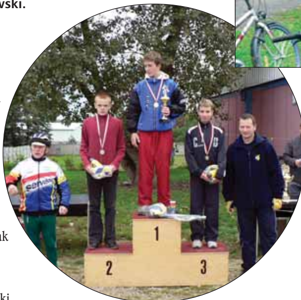
Najlepsi w kategorii gimnazjum stanęli na podium