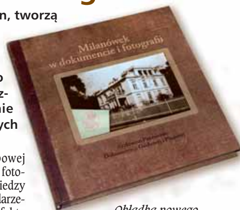
Okladka nowego albumu „Milanówek w dokumencie i fotografii”