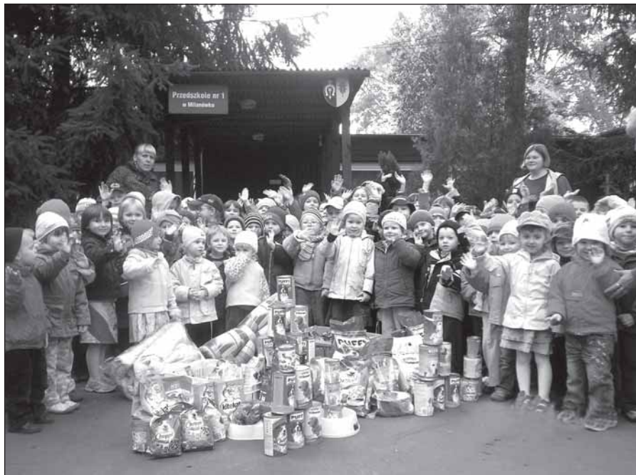
Dzieci przekazały na rzecz schroniska liczne paczki z żywnością i innymi artykułami dla zwierząt