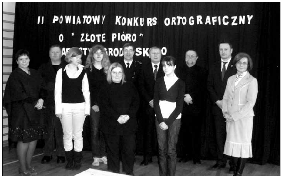
Uczestnicy konkursu wraz z organizatorami i przedstawicielami władz samorządowych