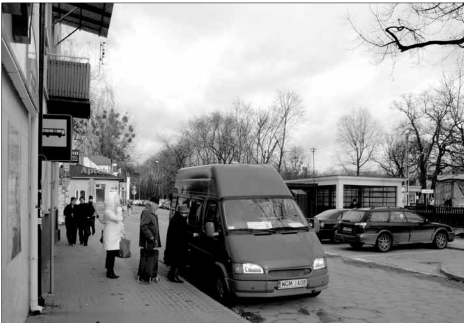
Przystanek komunikacji miejskiej przy ul. Krakowskiej

Więcej na temat komunikacji miejskiej na stronie www.milanowek.pl (banner ITV Milanówek)