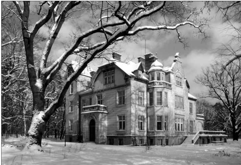
Zespół willowo-parkowy Turczynek, jeden z wielu obiektów wpisanych do rejestru zabytków

w Uchwale Nr 217/XXI/08 Rady Miasta Milanówka z dnia 27 listopada 2008r.