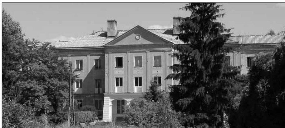
Dawny Dom Wystużonego Kolarza przy ul. Kościuszki

W takiej sytuacji pracownicy Ośrodka Pomocy Społecznej w Milanówku wkroczyli do akcji; znaleźli nowe miejsce dla pensjonariuszy i przekonali ich o konieczności przeprowadzki, którą zorganizowano natychmiast. Polski Komitet Pomocy Społecznej zobowiązał się jedynie, do ponoszenia kosztów po-