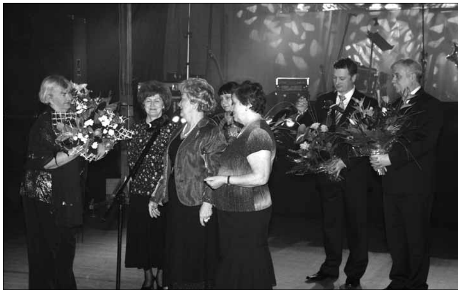
Organizatorzy otrzymali kwiaty z rąk przedstawicielek Zarządu