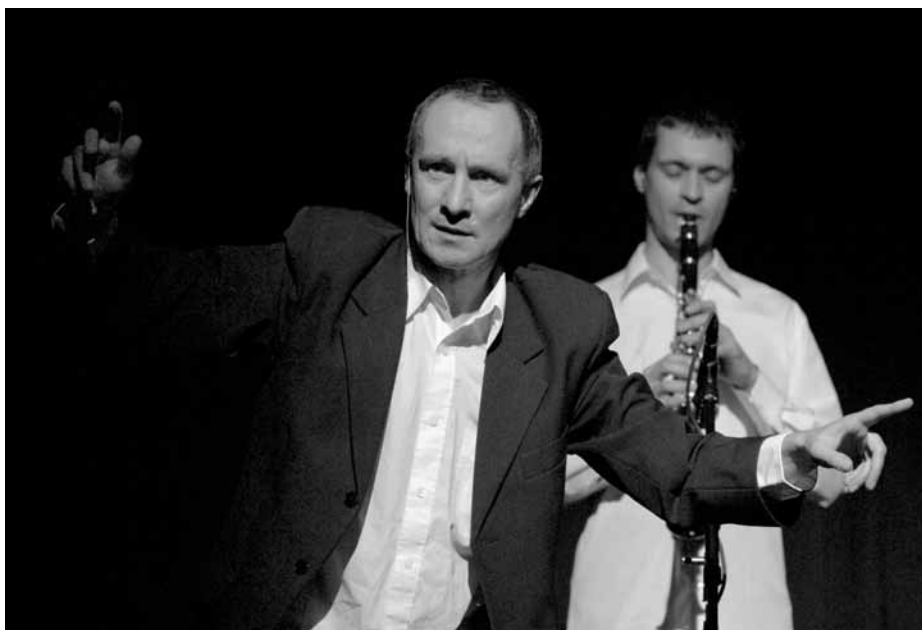
Podczas spektaklu „Tajbete i jej demon”