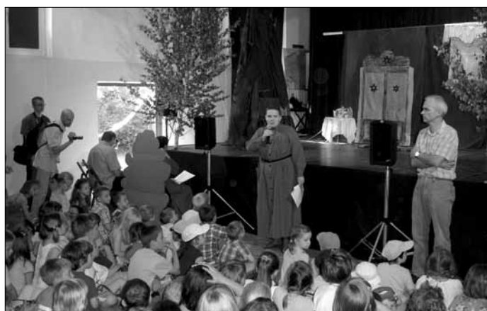
Przedstawienie pt. „Calineczka” wystawione podczas Festynu Urszulańskiego 2008, przygotowane przez ss. Urszulanki