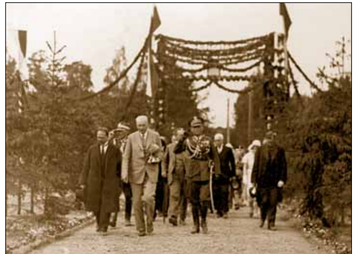
Wizyta Prezydenta prof. Ignacego Mościckiego w Centralnej Doświadczalnej Stacji Jedwabniczej

1930 – Milanówek odwiedza prezydent RP, prof. Ignacy Mościcki i dokonuje oficjalnego otwarcia CDSJ.