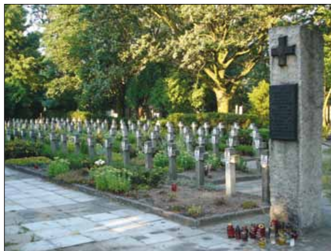
Kwaterna Powstańców Warszawy na cmentarzu w Milanówku, zmarłych na skutek ran, wycieńczenia i chorób w szpitalach PCK