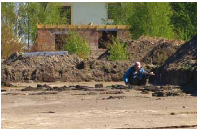
Prace archeologiczne na jednym ze stanowisk w Milanówku przy ul. Wojska Polskiego

Na obszarze od Warszawy po Milanówek i Grodzisk Maz. oraz od Nadarzyną po skraj Puszczy Kampinoskiej archeolodzy natknęli się na ślady osad, których mieszkańcy porzucili rolnictwo i zajęli się wytopem żelaza z kopanej na miejscu rudy darniowej. Jak na owe czasy był to przemysł na wielką skalę. Żelazo pozyskiwane w dymarkach przekuwano głównie na miecze, które w okresie między I w p.n.e. i IV w n.e. były głównym towarem eksportowym mieszkańców zachodniego Mazowsza. Specjaliści twierdzą, że broń ta nie ustępowała rzymskiej, a w walkach była ponoć lepsza. Według dyr. S. Woydy w mazowieckich kuźniach powstawały miecze, które zdobyły Wieczne Miasto, przy ich pomocy wojska barbarzyńskie zatrzymały nad Dunajem i Renem niezwyrodnione dotąd legiony rzymskie, a potem złupiły Rzym. 2 Z uwagi na ograniczone zasoby rudy żelaza w zachodnim rejonie Mazowsza w okresie średniowiecza zaprzestano wytopiania żelaza.