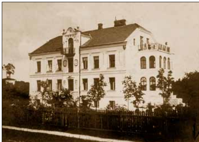
Willa „Bożenka” praktycznie od początku swojego istnienia służyła sprawom edukacji młodzieży

1922 – 15 sierpnia następuje reaktywowanie działalności Milanowskiego Towarzystwa Letniczego, które rozszerza