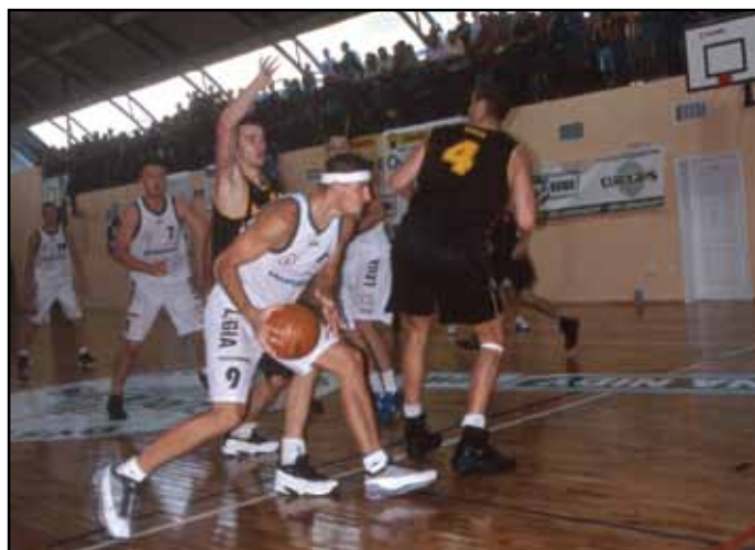
Na otwarcie hali – mecz koszykarski pomiędzy ligowymi drużynami Legii Warszawa i Prokodem Trefl Sopot

2002 – 7 września – Uroczyste otwarcie Miejskiej Hali Sportowej przy ul. Żabie Oczko 1 – pierwszej tego typu placówki w mieście.