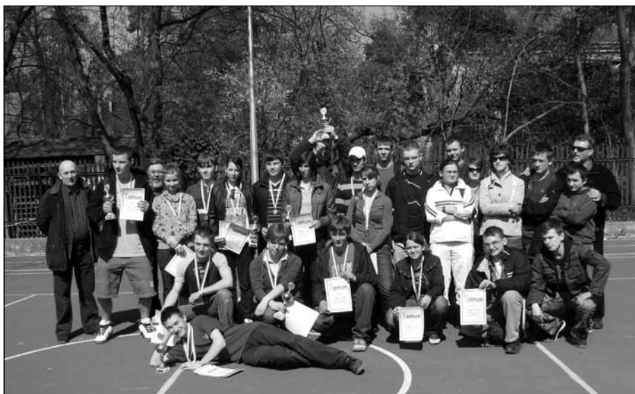
Nagrodzeni uczestnicy zawodów wraz z organizatorami