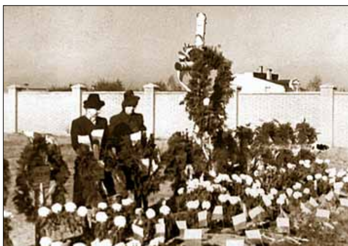
Pierwsze groby żołnierzy wojny obronnej we wrześniu 1939 r., fot. z 1943 r.

1939-1944 – Lata wojny to okres dobrze zorganizowanej w Milanówku walki z hitlerowskim okupantem, prowadzonej głównie przez Armię Krajową; działają dwa plutony liniowe, dwa Oddziały Specjalne Kedywu, radiostacje łączności z Londynem, obsługa i ochrona trzech sztabów różnych szczebli, odbiór wielu zrzutów, rozwija się tajny ruch wydawniczy, działa wywiad i kontrwywiad; na dużą skalę prowadzi się tajne nauczanie; ponad 30 mieszkańców bierze udział w Powstaniu Warszawskim