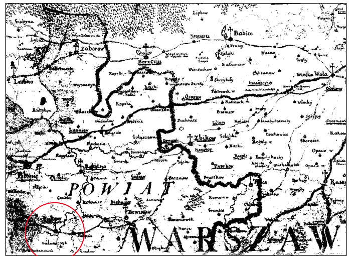
Fragment mapy fizjografa Pierwszej Rzeczypospolitej Karola de Pertheesa (1739-1815) z 1792 r.