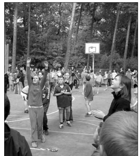
Tak było w poprzednich latach

nych, zajęć piłkarskiej ligi siódemek oraz 11 czerwca 2009.