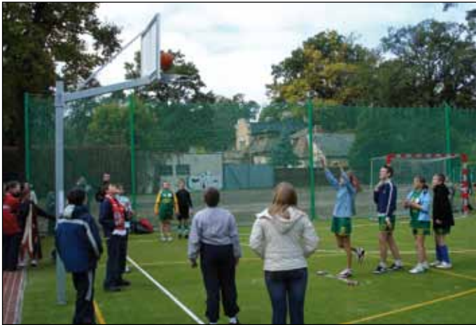
Zabawy i gry sportowe podczas otwarcia nowego boiska i bieżni przy Szkole Podstawowej Nr 2

2007 – 12 października: Otwarcie nowego wielofunkcyjnego boiska wraz z bieżnią tartanową w Zespole Szkół Gminnych nr 3. Wokół boiska zainstalowano 4 maszty oświetleniowe. W tym samym roku oddano do użytkowania zmodernizowane boisko przy Szkole Podstawowej nr 2.