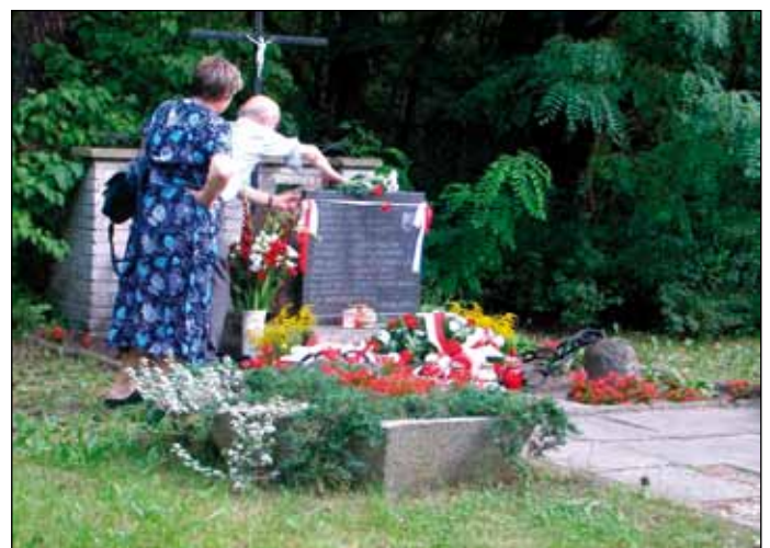
Tablica upamiętniająca zamordowaną przez Niemców załogę magazynu broni – miejsce refleksji historycznej

1944 – W nocy z 9 na 10 sierpnia Niemcy likwidują duży magazyn broni obw. Bażant ośr. Mielizna AK przy ul. Chrzanowskiej (obecnie Wojska Polskiego), a załogę mordują. Wydarzenia sprzed lat upamiętnia tablica w miejscu zbrodni. Mogiła zbiorowa zamordowanych znajduje się na milanowskim cmentarzu.