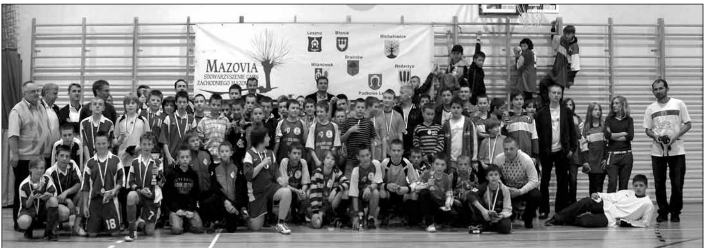
Pamiątkowe zdjęcie uczestników i organizatorów turnieju