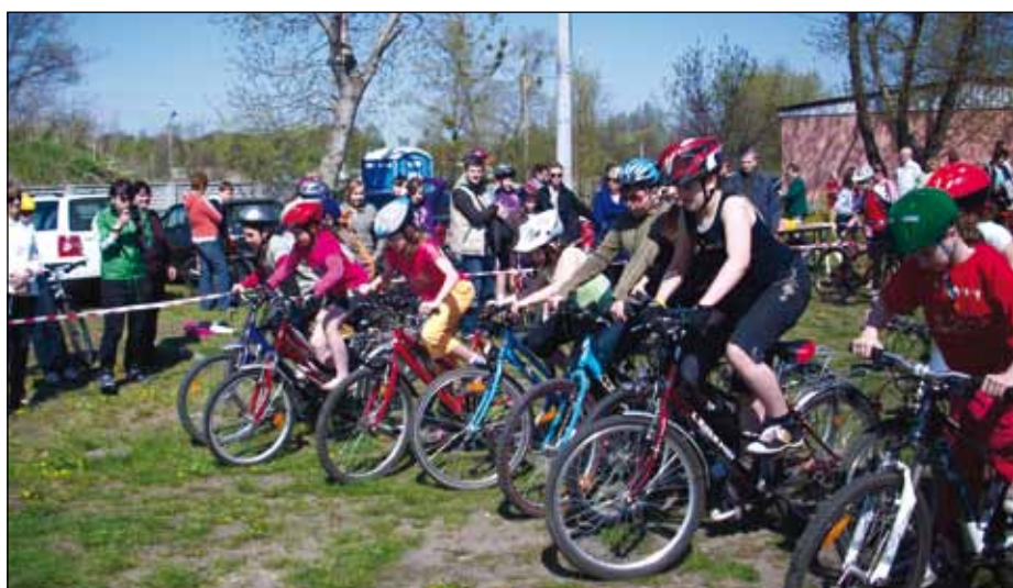
Uczestnicy zawodów kolarskich po raz kolejny wykazali się doskonałą kondycją