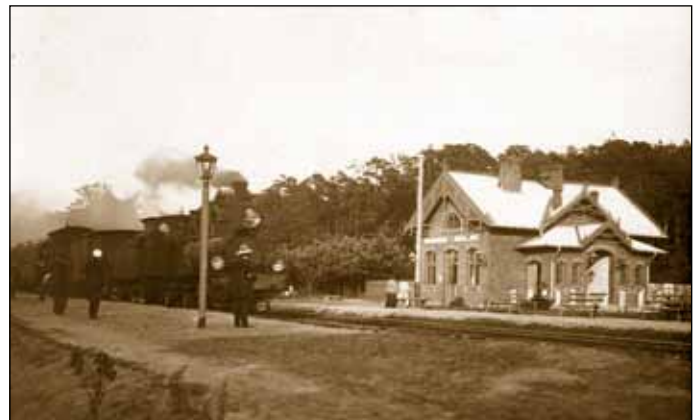
Przystanek Kolei Warszawsko-Wiedeńskiej w Milanówku

1908 – 3 września rozpoczyna działalność Milanowskie Towarzystwo Letnicze, którego członkowie szybko tworzą podwaliny społeczeństwa obywatelskiego. Mimo iż formalnie Letnisko Milanówek znajduje się w strukturze gminy Grodzisk Maz., to dzięki aktywności członków MTL stopniowo się usamodzielnia, powstaje załóżek samorządu. MTL troszczy się o zaspokajanie najpilniejszych potrzeb lokal-