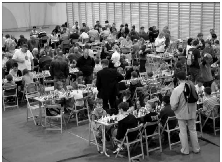
203 zawodników wzięło udział w tegorocznych mistrzostwach szachowych ▶

Zawody miały na celu popularyzację sportu szachowego na terenie Mazowska i Milanówka. Cechowały się wysokim poziomem sportowym i organizacyjnym.