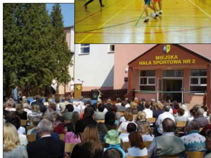
Inauguracyjny mecz piłkarski pomiędzy reprezentacjami ZSG Nr 1 i ZSG Nr 3 w Milanówku