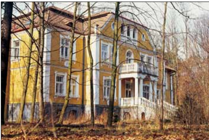
W tej willi przechowywano meldunki wywiadu przemysłowego