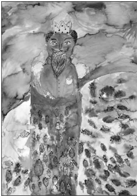
Praca Pauliny Popiel (13 lat) z Żyrardowa „O Popielu co go myszy zjadły”

plastyki oraz Cukierni MILAGRO ul. Dworcowa 2 (pawilon 6) za tort – nagrodę niespodziankę, którą rozlosowaliśmy wśród wszystkich uczestników milanowskiego wernisażu.