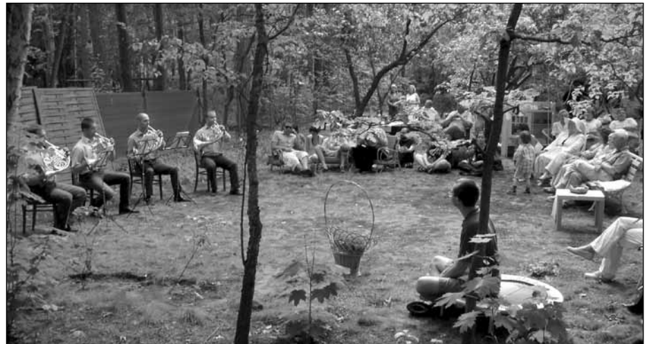
Tak było podczas III Festiwalu Otwarte Ogrody 2008; koncert w ogrodzie przy ul. Parkowej

Po dniach pełnych wrażeń wieczorem w niedzielę 7 czerwca w Milanowskim Centrum Kultury odbędzie się koncert zamknięcia. Koncertem zatytułowanym „Przeboje Starego Kina” pragniemy podziękować otwierającym swoje ogrody oraz uczestnikom Festiwalu i zaprosić na kolejną jego edycję.