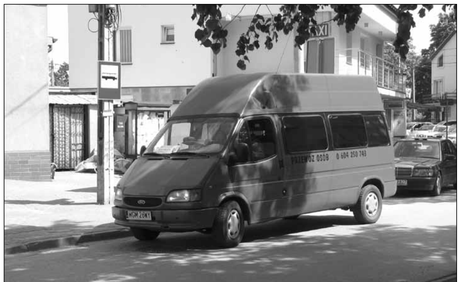
Jeden z przystanków komunikacji miejskiej w Milanówku