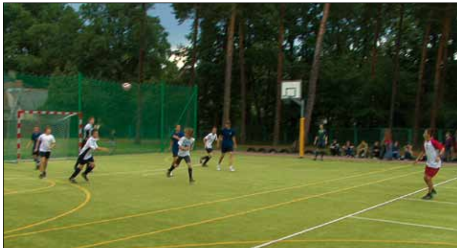
Wszystkie mecze Milanowskiej Ligi Siódemek odbywały się na boisku Szkoły Podstawowej nr 2

Najlepszy strzelec – Magda Pająk (Złodzieje Medali 3 gole)