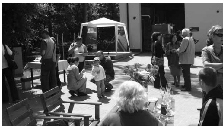
Fragment Ogródku Historycznego APDOiP

W programie spotkania znalazły się prelekcje przygotowane przez pracowników Archiwum Głównego Akt Dawnych oraz Filmoteki Narodowej. Poruszono w nich m.in. temat ochrony oraz przechowywania domowej biblioteki i archiwum. Osoby zainteresowane tym zagadnieniem mogły skorzystać ze specjalistycznych porad dotyczących konserwacji archiwaliów. Chętnych zaproszono również do zwiedzenia magazynów