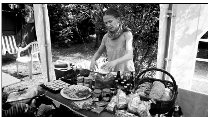
Ogród chrześcijański – degustacja jamajskich wegetariańskich potraw