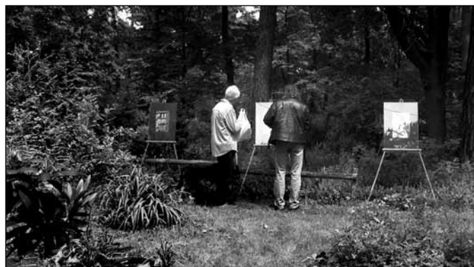
Ogród Zwyczajnego Piękna – „Miejsca zaginione” – wystawa fotografii Ewy Januszewskiej