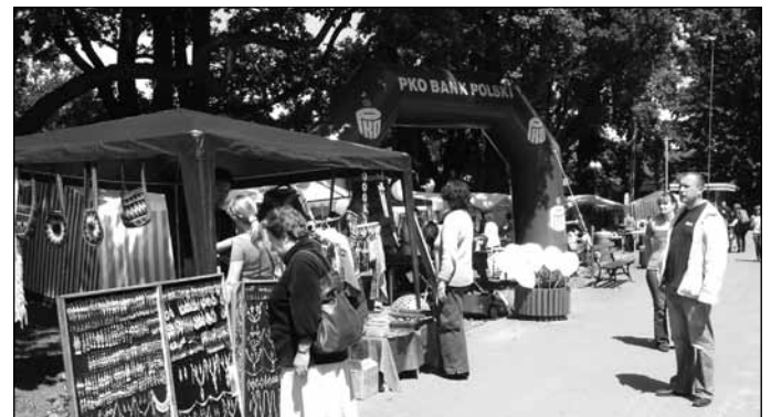
Ogród przy Jedwabnym Zakątku – kiermasz Artystyczny Krąg, warsztaty malowania na jedwabiu