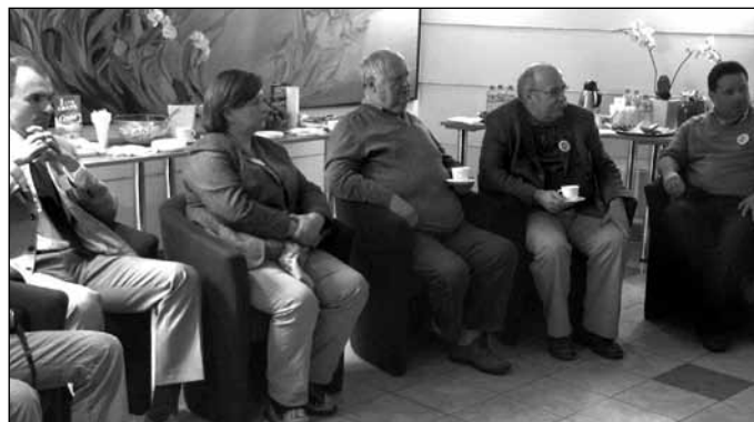
Ogród wspomnień – Międzynarodowy zjazd Milanowian; Organizator: Biuro Promocji Miasta Urzędu Miasta Milanówka i Towarzystwo Miłośników Milanówka