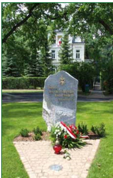
Pamiątkowy kamień na skwerze im. Ojca Świętego Jana Pawła II, tuż po odsłonięciu