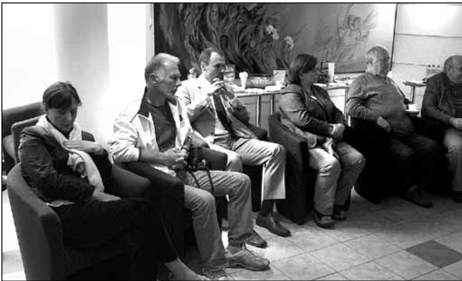
Uczestnicy spotkania dzielili się swoimi wspomnieniami z czasów, gdy mieszkali w Milanówku

P.S. Fragmenty ze spotkania będzie można obejrzeć w relacji filmowej na stronie ITV Milanówek: http://milanowek.pl/multimedialna/