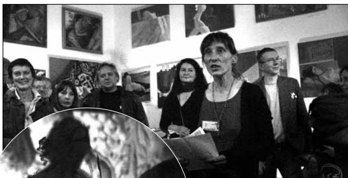
Ogród K 87 – otwarcie wystawy pt. „Akty w małym mieście” – malarstwo, rysunek, grafika; Happening „malowanie aktów”