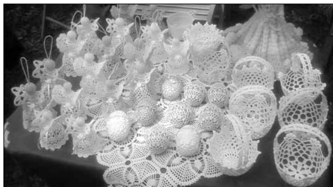
Ogród Artystyczny „Powrót do tradycji”; Rękodzieło artystyczne z Milanowianinem i niespodziankami w tle. Organizator: Fundacja „Homo Homini”