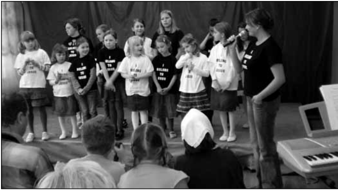
Teatr w ogrodzie – teatry szkolne, występ chóru szkolnego