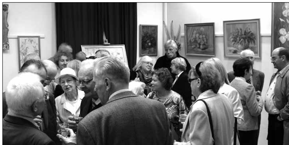
Zebrani Goście podczas wernisażu