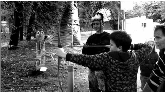
Ogród strzelecko-muzyczny – zawody strzeleckie w stylu western, zabawa taneczna w stylu country („Polskie dechy”), grill, plener zdjęciowo-plastyczny, tuki, konkursy; Organizator: Sekcja strzelecka przy Zespole Szkół nr 1