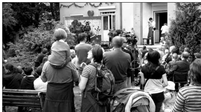
Ogród dla dzieci „Święto Truskawki” – przedstawienie teatralno-muzyczne „Dyzio i Dodo razem z przyrodą” – artyści z Krakowa; Organizator: Truskawkowe Przedszkole