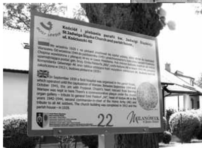
Jedna z tablic informacyjnych na szlaku