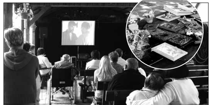
„Historia miłości”; Przedstawienie „Nostalgiczna historia o miłości skłaniająca do przemyśleń i refleksji” oraz wystawa prac wykonanych przez osoby niepełnosprawne z Warsztatu Terapii Zajęciowej przy Domu Rehabilitacyjno-Opiekuńczym KSN AW