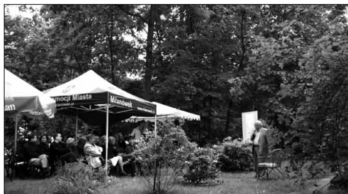
Ogród Zwyczajnego Piękna – „Miejsca zaginione”; Esej pt. „Piękno zwyczajne w architekturze i w krajobrazie polskim” wygłosił prof. J.T. Królikowski z Katedry Sztuki Krajobrazu SGGW w Warszawie