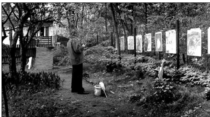
Ogród Misia Puchatka – wystawa rysunku i malarstwa Marka Ołubka „Człowiek i rodzina”