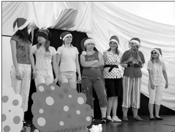
Z okazji Święta Szkoły przygotowano bogatą część artystyczną