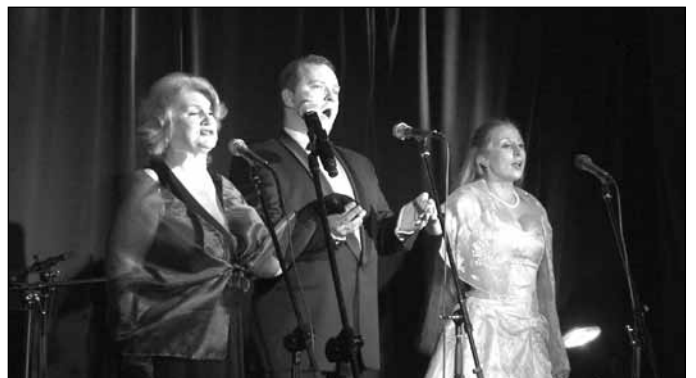
Uroczyste zakończenie Festiwalu Otwarte Ogrody – koncert „Przeboje starego kina”