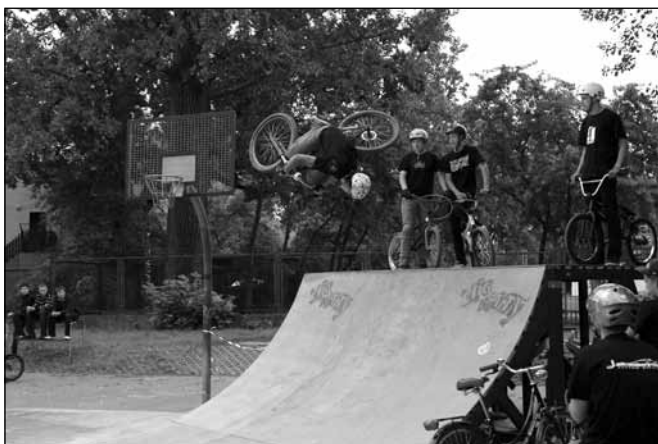
Uczestnicy zawodów podczas wyczynów sportowych