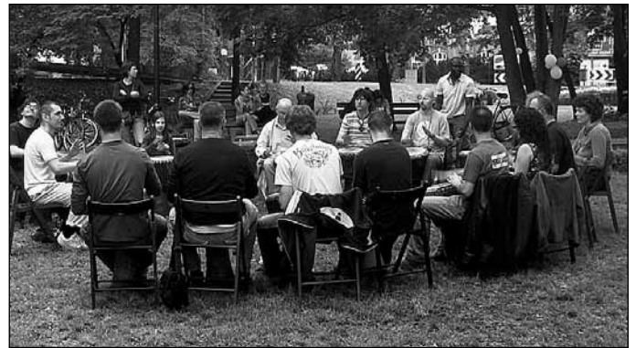
Warsztaty dla Taty – warsztaty: bębniarskie, „Dobry ojciec”, kaligrafii japońskiej, jogi; Organizator: Stowarzyszenie Cynamon