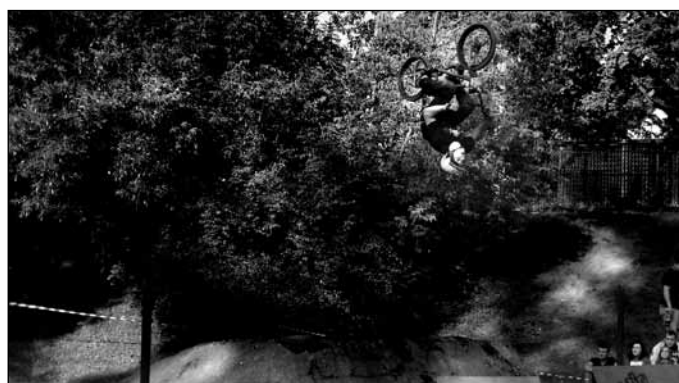
Ogród ekstremalny – sporty ekstremalne w harmonii z przyrodą – pokazy skoków rowerowych