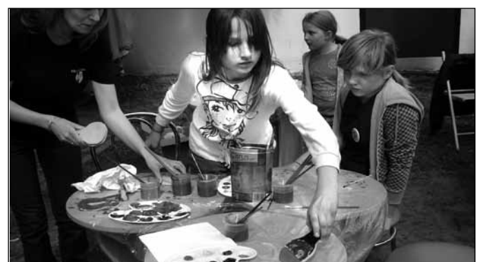
Ogród bajkowo-filmowy przy Teatrze Letnim; warsztaty plastyczne dla dzieci