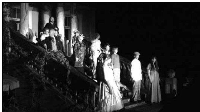
Zaczarowany dom – spektakl słowno-muzyczny, światło i dźwięk; Organizator: Milanowski Uniwersytet Trzeciego Wieku, Teatralny zespół międzypokoleniowy (MU3W i Gimnazjum Społeczne), Milanowskie Centrum Kultury