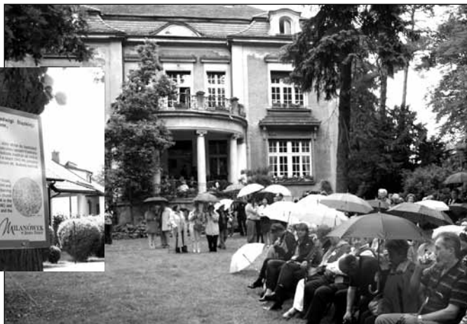
Uroczystość otwarcia szlaku Milanówek – „Mały Londyn” w willi „Emanów”

Szlak ten nie jest stricte skierowany do jednej grupy odbiorców. Jest zarówno znakomitym rozwiązaniem na poznanie oraz krzewienie lokalnego patriotyzmu wśród dzieci i młodzieży, jak również możliwością poznania historii II wojny światowej, zwłaszcza na terenie Milanówka, przez mieszkańców i gości naszego miasta.