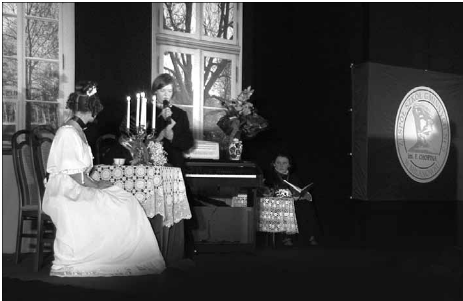
Młodzi artyści ze Szkolnego Koła teatralnego podczas przedstawienia poświęconego Fryderykowi Chopinowi