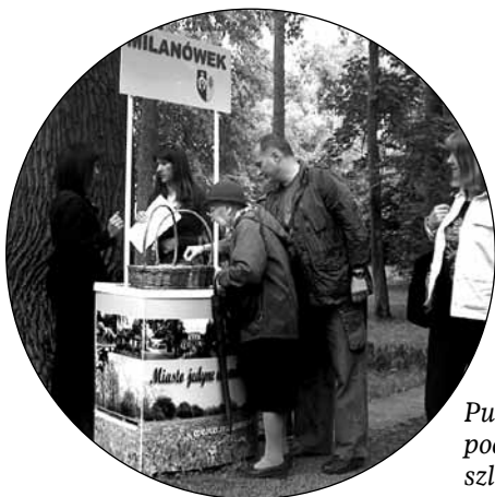
Punkt informacyjny podczas otwarcia szlaku Milanówek – „Mały Londyn”