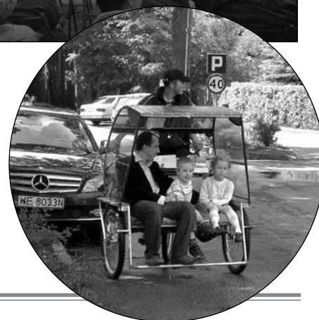
Nowo otwarty szlak można było przemierzać przy pomocy pojazdów zwanych riksami