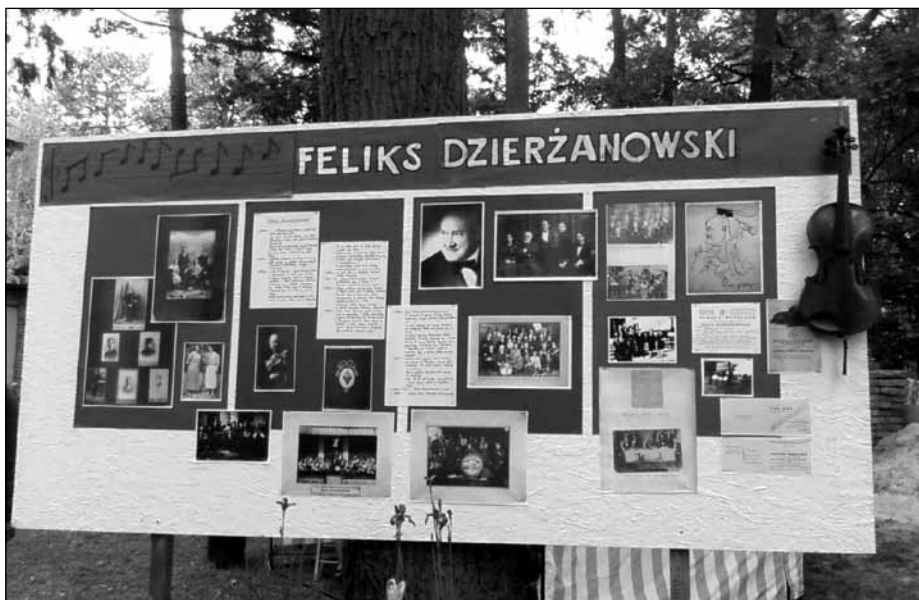
Wystawa poświęcona Feliksowi Dzierżanowskiemu w ogrodzie Fundacji Homo Homini

Fundacja Homo Homini istnieje w Milanówku od 1992 roku. Działalność fundacji dotyczy wszelkiej pomocy osobom samotnym i potrzebującym (między innymi Wigilia Samotnych), a także tematyki rękodzieła artystycznego, które stanowi pomost do integracji osób uzdolnionych artystycznie z wszystkimi chętnymi do działania w tej dziedzinie.