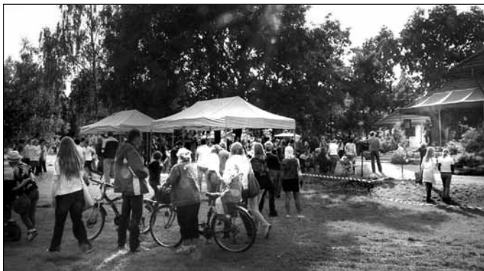
Angielski piknik – angielskie gry i zabawy z nagrodami, konkursy dla dzieci, młodzieży i rodziców – muzyka na żywo, nauka tańca irlandzkiego; Organizator: Foster Kids – Szkoła Języka Angielskiego