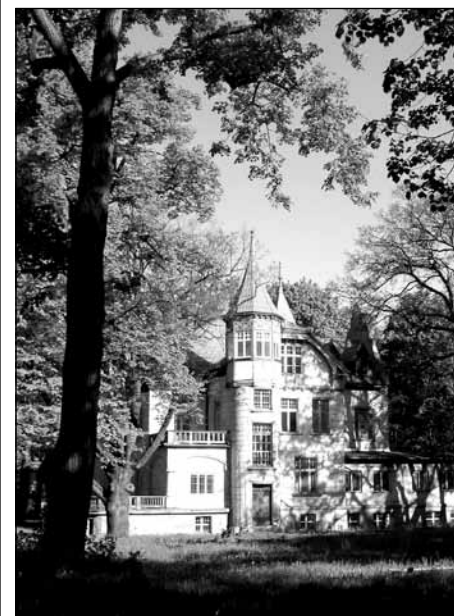
Zabytkowy kompleks parkowo-willowy „Turczynka” – jedno z wielu miejsc godnych polecenia odwiedzającym Milanówek turystom