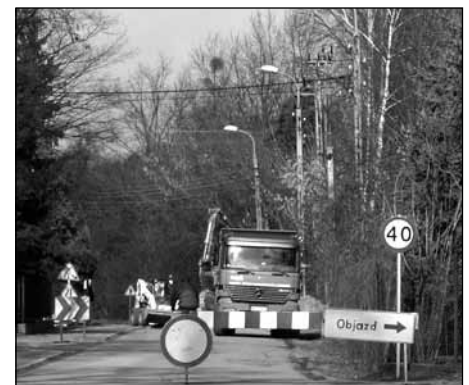
Realizacja Kanalizacji przy Wojska Polskiego