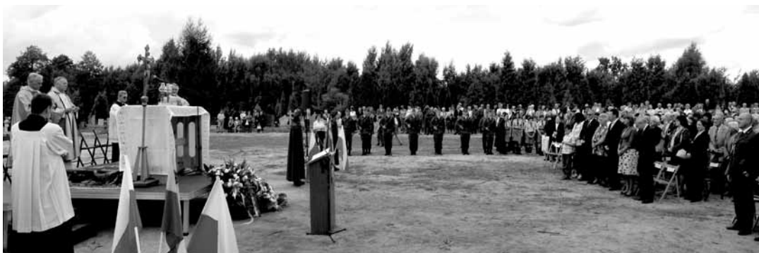
Podczas Mszy św.

Dzięki dofinansowaniu władz samorządowych Milanówka w ostatnich dwóch latach została położona kostka na głównych alejach starego i nowego cmentarza, wyrównano też teren i zmodernizowano ogrodzenia, dodając bramy od strony południowej. W tym roku z okazji 70-lecia, ponownie przy dofinansowaniu samorządu, wybudowano symboliczną Bramę Główną, którą zaprojektował architekt Marek Ziarkowski oraz wymieniono ogrodzenie od strony ul. Wojska Polskiego, nawiązując do stylistyki ogrodzenia kościoła św. Jadwigi w Milanówku. – Przez te kilka lat nad pracami w tym miejscu zo-