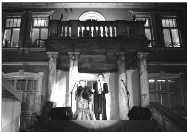
Koncert zespołu CAMERATA pt. „Od Straussa do Kiepury” z wykorzystaniem przestrzeni ogrodowo-architektonicznej willi Waleria na zakończenie Festiwalu Otwarte Ogrody 2007