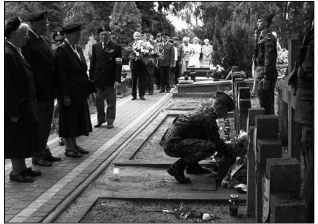
Złożenie kwiatów na grobach żołnierzy września 1939

Milanowski cmentarz parafialny powstał w 1939 r. na działkach zakupionych już w latach 1928-29, lecz uzyskanie formalnej zgody władz na utworzenie cmentarza grzebalnego przeciągało się z powodu sprzeciwów najbliższych sąsiadów. Do tego czasu zmarłych milanowian chowano m.in. w Żukowie, Brwinowie, Grodzisku i w Warszawie. Wybuch wojny wszystko zmienił i już w pierwszych dniach września pochowano tutaj pierwsze ofiary. Podczas II wojny światowej spoczęli tu zwłoki ofiar wojny. Były to osoby zmarłe w wyniku wycieńczenia i ran, wśród nich uczestnicy Powstania Warszawskiego, chorzy ze szpitali warszawskich ewakuowanych do Milanówka. Pochowano ich w specjalnie wydzielonej kwaterze. Dodatkowo powstał symboliczny grób Męczenników Oświęcimia i innych obozów. Formalne poświęcenie cmentarza odbyło się 23 października 1939 r.