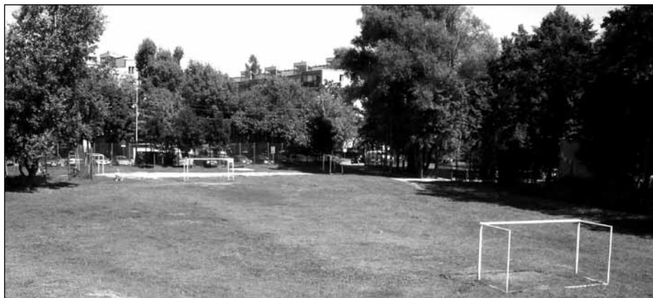
Miejsce, w którym przewiduje się zamontowanie kamer monitoringu miejskiego na os. Jedwabnik, z uwzględnieniem boiska obok basenu – tutaj niebawem powstaną boiska do gry w piłkę tzw. „Orliki”

Zmieniono również uchwałę z dnia 27 stycznia 2005 r. w sprawie: przyjęcia Wieloletniego Planu Inwestycyjnego na lata 2005-2013. Podjęcie uchwały było spowodowane zmianami budżetu. Rada uchwaliła również nabycie części nieruchomości gruntowej przy ul. Warszawskiej i w formie darowizny udziału – połowy części nieruchomości, przy ul. Wylot. Natomiast zbycie gruntu przy ul. Krasieńskiego ma poprawić warunki zagospodarowania działki przyległej. W tym samym celu podjęto uchwałę o zbyciu połowy działki przy ul. Krasieńskiego.