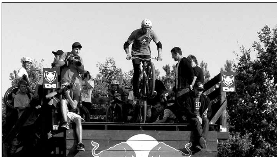
VI Edycja Mistrzostw Polski Dig-Nitty Dirt Jump MTBMX&Outdoor Park – start jednego z zawodników