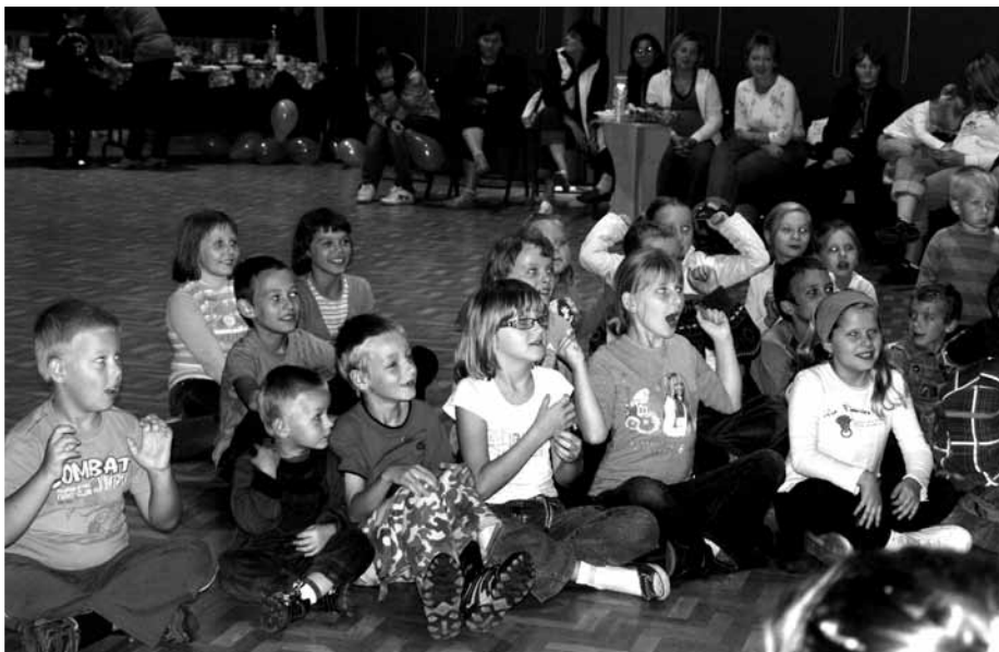
Dzieci były roześmiane i szczęśliwe

W dniu 5 września 2009 r. z inicjatywy Ośrodka Pomocy Społecznej w Milanówku i Pełnomocnika Burmistrza ds. Profilaktyki i Uzależnień w partnerstwie z Milanowskim Centrum Kultury odbył się festyn rodzinny, skierowany do rodzin z dziećmi w wieku od 3 do 12 lat. Celem imprezy była promocja zdrowego stylu życia, wzmocnienie więzi rodzinnych, integracja społeczna.