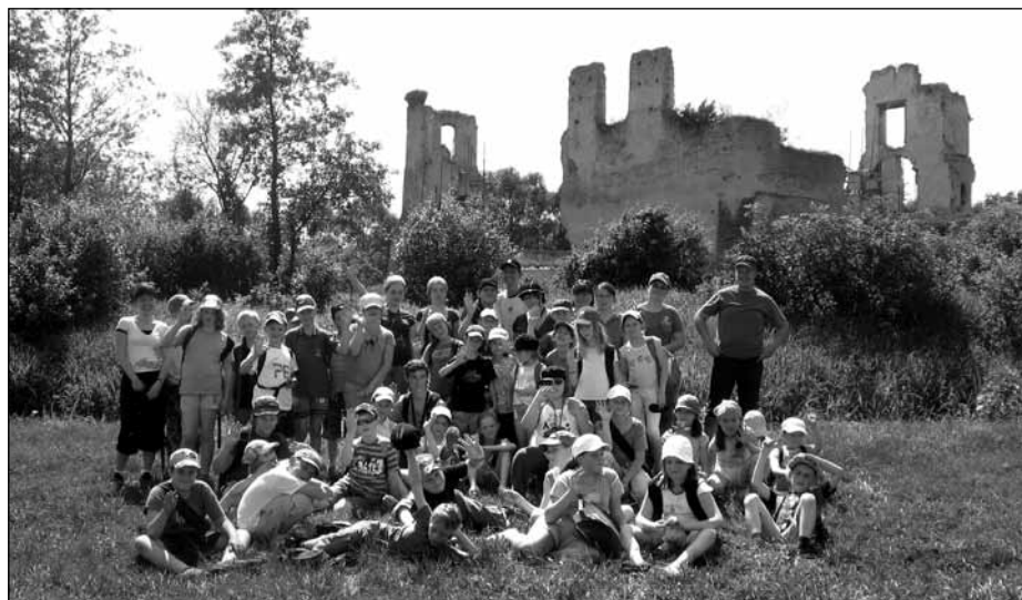
Zuchy na wędrówce

W kręgu harcerskiego ognia znalazł się czas na piosenkę, taniec, refleksje i nawiązywanie nowych przyjaźni. Każdy stał ciemną nocą na warcie, podchodził inne obozy,