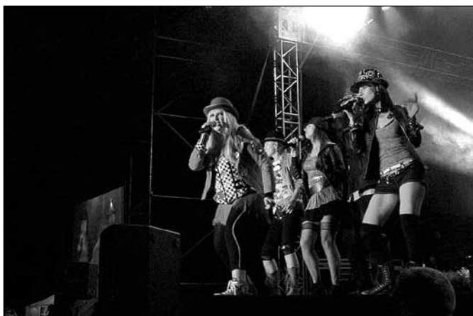
Maryla Rodowicz podczas koncertu z zespołem

Tegoroczny Dzień Milanówka to przede wszystkim dowód na to, że mieszkańcy miasta i okolic potrafią się doskonale bawić. „Bo tu jest Milanówek, a co tam jakieś Rio...” – śpiewała Maryla Rodowicz wraz z całą publicznością. Do następnego lata, święto naszego miasta będzie kojarzyć się właśnie z tym utworem. Pogoda dopisała, a bogaty program wywołał ogromne zainteresowanie. Na stadionie Turczynek gościliśmy prawdziwe tłumy, zwłaszcza w trakcie koncertu Pani