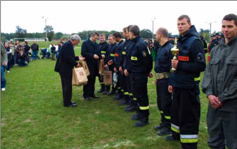
Rozdanie nagród zwycięzcom