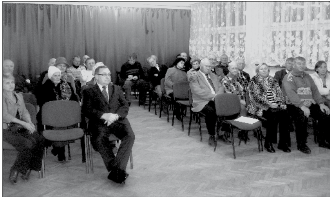
Mieszkańcy pytali o sprawy, które najbardziej ich interesowały

Innym zagadnieniem poruszonym przez zebranych, była sprawa budowy kanalizacji. Niektórzy twierdzili, że planowanie kolejności budowy kanałów sanitarnych wygląda na przypadkowe. Władze wyjaśniły, że kanalizacja budowana jest w oparciu o opracowaną w 90. latach koncepcję rozbudowy systemu kanalizacji. Koncepcja ta określa, które odcinki kanałów można połączyć ze sobą, aby ścieki mogły spłynąć do jednego punktu, z którego później będzie można je skierować do oczyszczalni. – Kanalizacji nie można budować według innych kryteriów, niż techniczne możliwości. W Milanówku kanalizacja budowana jest w systemie grawitacyjnym z wieloma zlewniami, z których ścieki