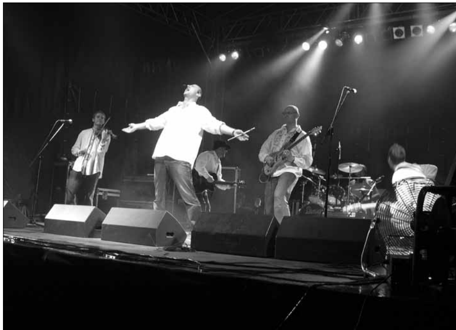
Zespół REDLIN na scenie

REDLIN to sześciu dynamicznych i radosnych muzyków, wspaniałe głosy, niezwykle brzmienia – czerpiące z rytmów celtyckich, góralskich, amerykańskich, rosyjskich.