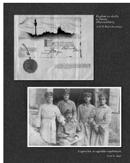
Fragment publikacji „Cmentarz w Milanówku. Przewodnik biograficzny”

Ukazanie się przewodnika było możliwe dzięki pomocy wielu instytucji i zaufaniu osób prywatnych. Rodziny przekazujące informacje i dokumenty