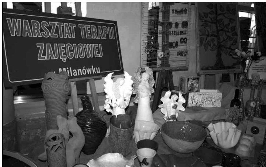
Dzieci pokazały prace, które zachwyciły gości formą i pomysłowością