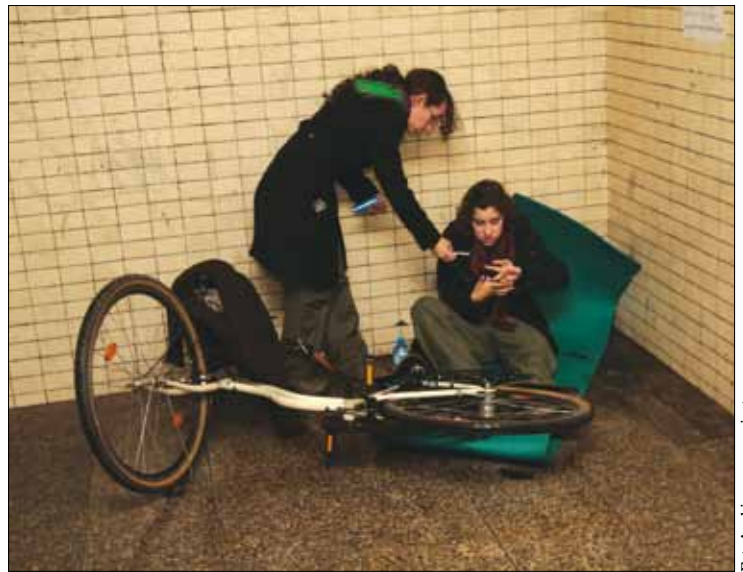
Symulacja wypadku odbyła się w przejściu podziemnym dworca kolejowego w Milanówku