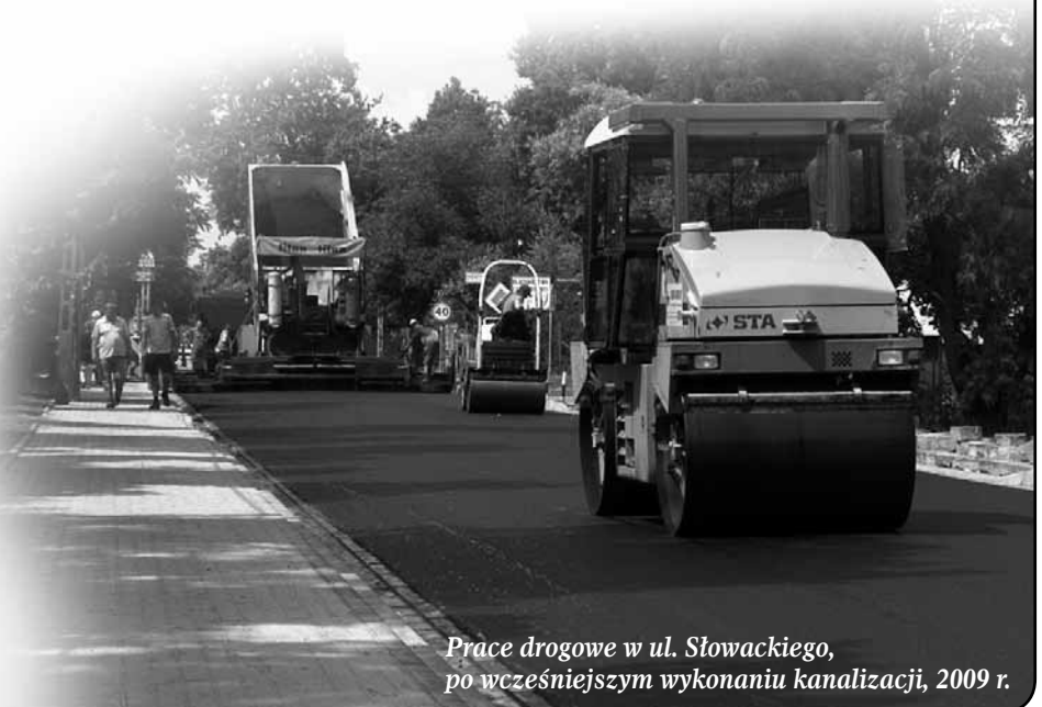
Prace drogowe w ul. Słowackiego, po wcześniejszym wykonaniu kanalizacji, 2009 r.