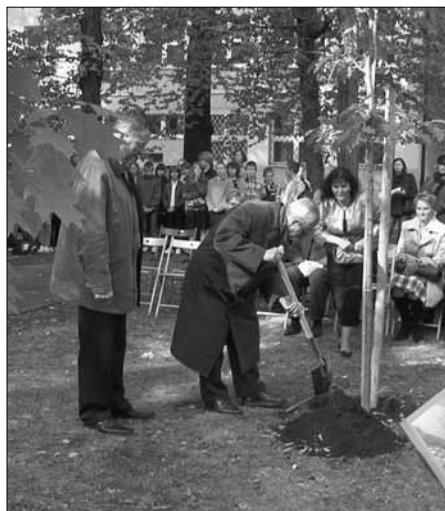
Dęby Pamięci posadziły m.in. rodziny pomordowanych