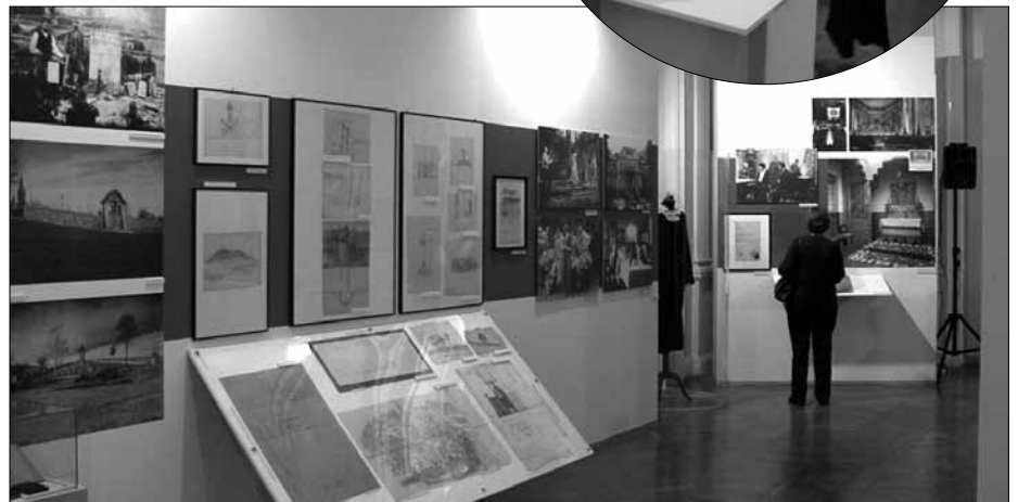
Fragmenty wystawy w Muzeum Niepodległości