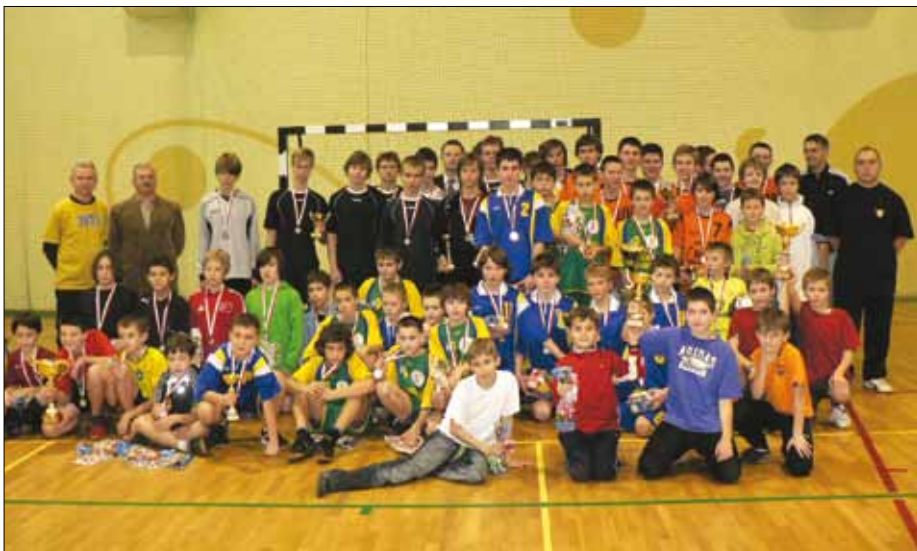
Pamiątkowe zdjęcie po zaciętych rozgrywkach