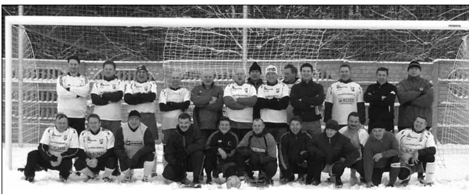
Zawodnicy KS „Milan”

Zajęcia obejmują gry i zabawy z piłką, oraz ćwiczenia ogólnorozwojowe. Chłopcy zaczęli treningi od letniego obozu przygotowawczego. Obecnie drużyna gra w rozgrywkach MZPN w grupie „ORLIKI”, zajmując V miejsce.