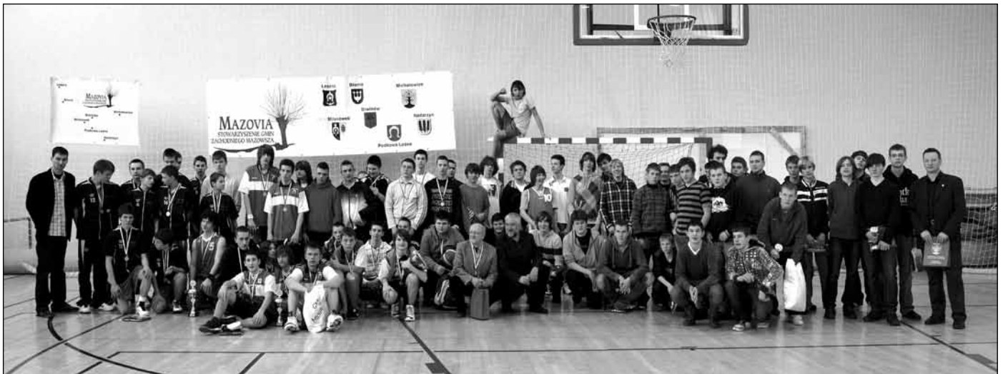
Zmagania turniejowe dostarczyły widzom wielu emocji