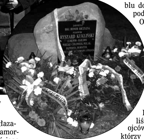
Tablica pamiątkowa poświęcona płk. Ryszardowi Kuklińskiemu