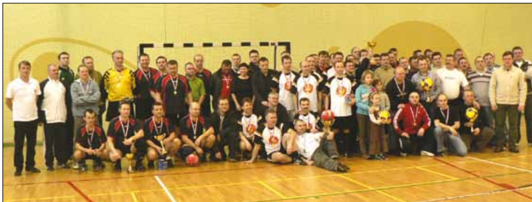
Uczestnicy turnieju VIII edycji Pucharu Ligi Oldbojów