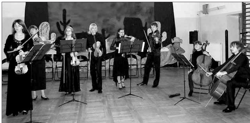
Koncert Szkolnej Kameralnej Orkiestry Smyczkowej ze Lwowa

ukraińskiej i światowej klasyki, czarując widownię mistrzowską grą, wdziękiem scenicznym i autentyzmem swego talentu. Owacja na stojąco i wielokrotne bisy to z serca płynące podziękowania za przeniesienie w fascynujący wielki świat muzyki i cudownego brzmienia skrzypiec oraz ludzkiego głosu. Komentarze po koncercie można było zamknąć w słowach: zachwyt, euforia, oczarowanie, podziw, szacunek. Uczniowski koncert z sercem na dłoni to najlepszy prezent dla ludzi zawodowo związanych ze szkołą i oświatą. Dziękujemy Panu Burmistrzowi Jerzemu Wysockiemu za ten szczególny prezent przygotowany na ten jedyny w roku dzień.