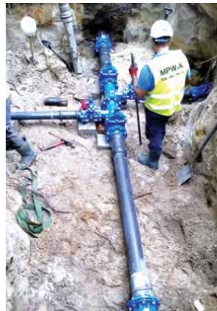
Zasuwa po wymianie