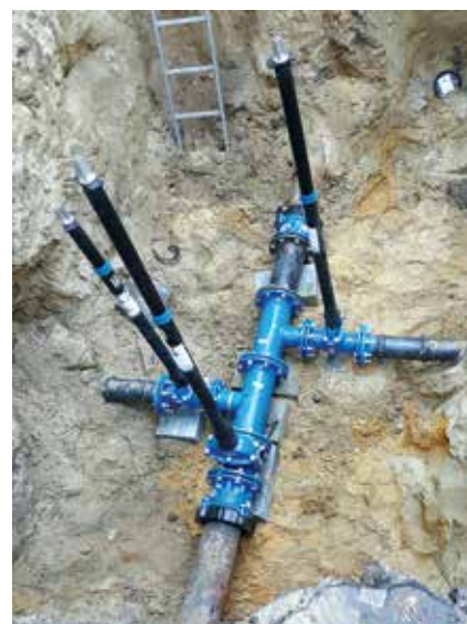
Zasuwa po wymianie