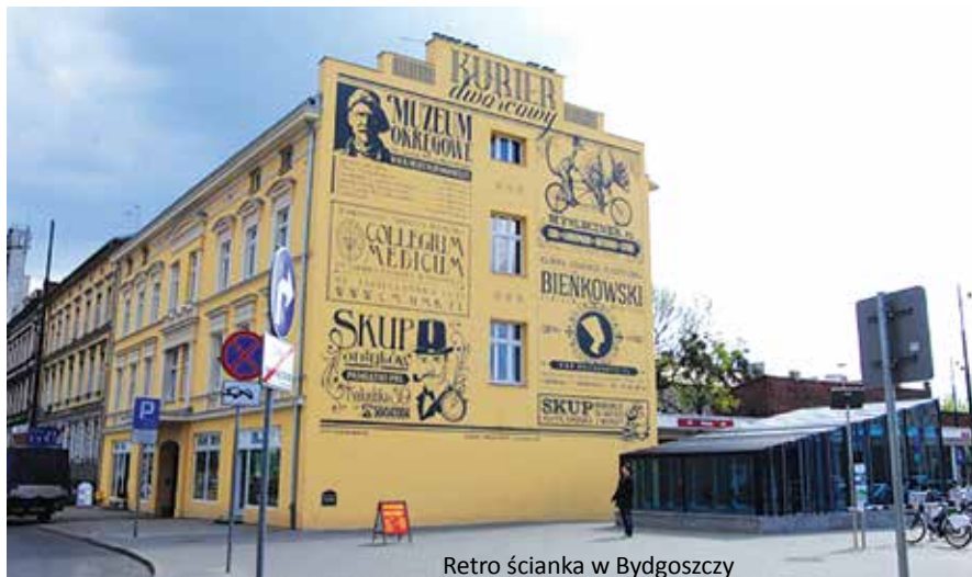
Retro ścianka w Bydgoszczy