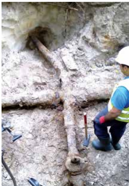
Zasuwa węzłowa – róg Piaski