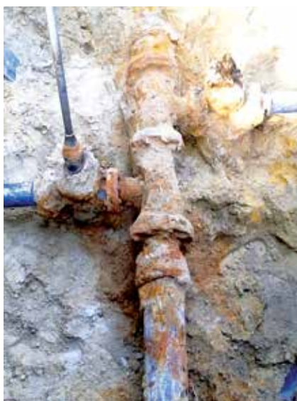
Wymiana zasuw węzłowej – róg Wigury