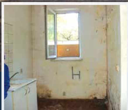
■ Prawda o eksmisjach w Milanówku – str. 7