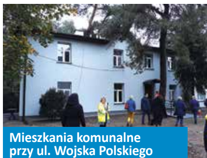
Mieszkania komunalne przy ul. Wojska Polskiego

Wartość inwestycji: 1 970 000 zł Długość drogi: ok. 600 m