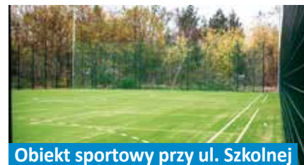
Obiekt sportowy przy ul. Szkolnej

Wartość wykonanej części inwestycji: 994 000 zł