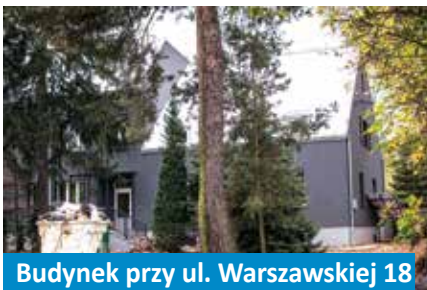
Budynek przy ul. Warszawskiej 18

Budynek, który mieścił niegdyś przedszkole, a niebawem zostanie przeznaczony na cele kulturalno-społeczne miasta, został poddany w ostatnich miesiącach termomodernizacji.