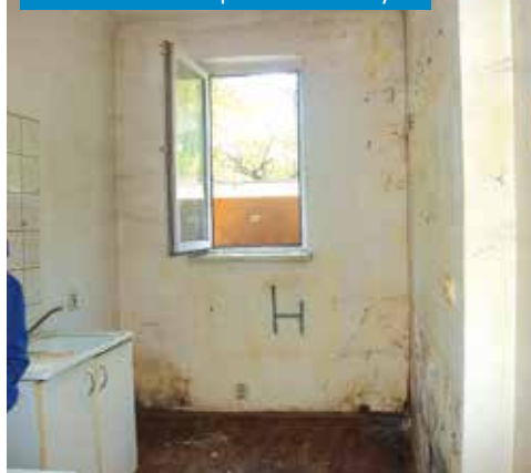
Zaniedbane lokale po eksmitowanych