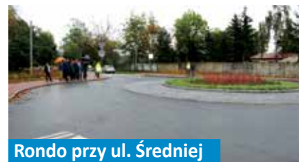
Rondo przy ul. Średniej

Wartość I części inwestycji: ok. 1 242 000 zł